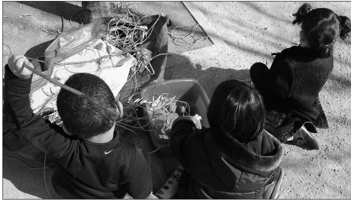
1. « Maintenant, vous pouvez prendre ce que vous voulez... » (photo de l'artiste, 2005).

fabriquer une cabane. Y a un grand sac avec plein de matériaux, des branches, des feuilles, des ficelles... » /