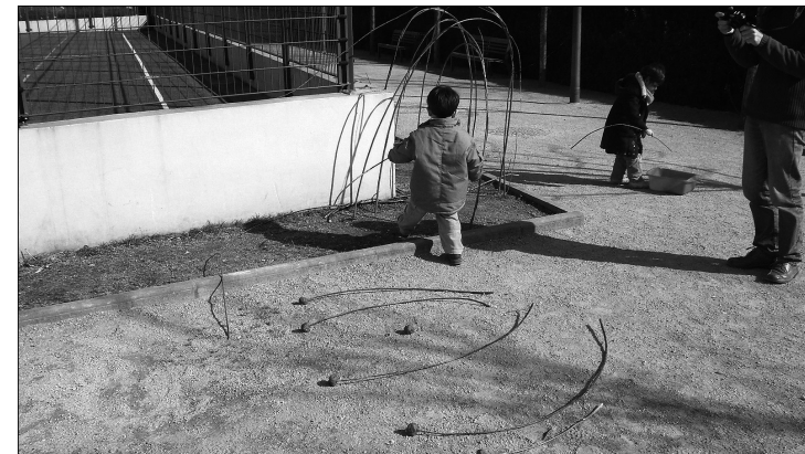
2. L'artiste prélève une forme au sol, réalisée collectivement par les enfants.

de la même classe, on aurait déduit le contraire : car l'artiste y apparaissait bien plus préoccupé par ce que les enfants étaient capables de faire librement avec des matériaux divers que par une gestion performante de dynamique du groupe et d'apprentissage orienté. Le changement d'attitude de Loïc entre les deux séquences