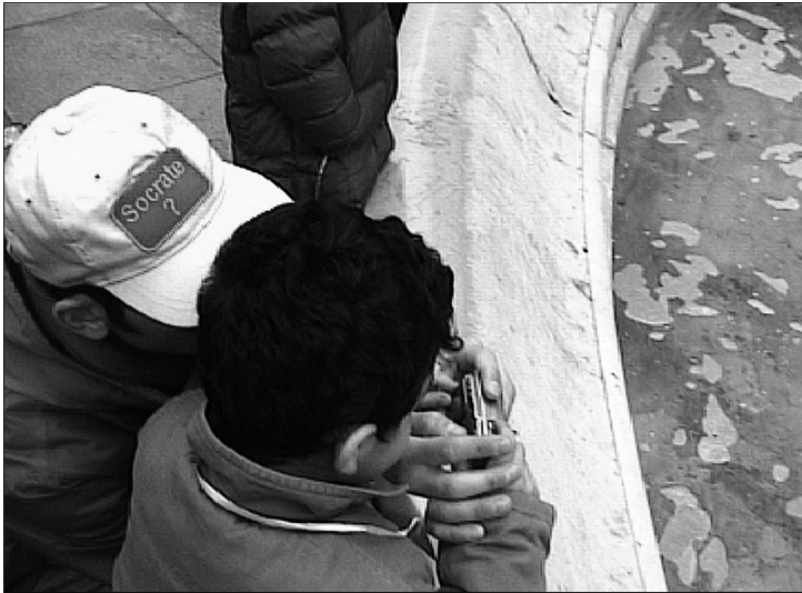
6. Des actes et des mots, susciter une « intention ». L'artiste maëuticien ? (Image fixe extraite d'une vidéo de l'auteur, 2006.)

métaphore du chemin (« je prends la piste des enfants », « je suis un fil » – du verbe suivre –, « lignes directrices »...) pour caractériser la « logique de projet », plus proche du processus que de l'état stable.