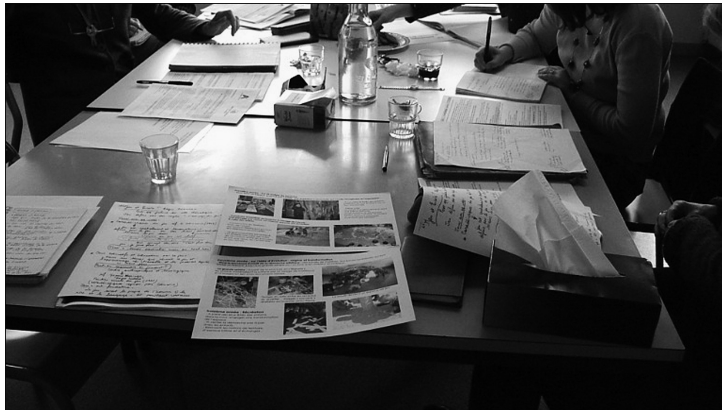
5. Réunion d'équipe. Au premier plan, un document images-textes de l'artiste retraçant les réalisations des deux premières années du programme.

verts pour aménagement paysager ou livraison de branches de saules, comme ce fut le cas dans l'école où travaillait Loïc...)