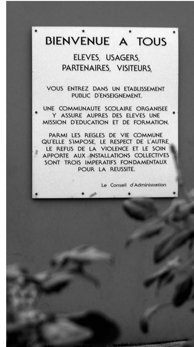
6. L'ordre scolaire : messages du seuil à l'entrée d'un lycée professionnel à Lyon.

Du point de vue de ce troisième motif, notre dossier se veut ouvert. Les auteurs sont chercheurs en ethnologie (Barbier-Le Déroff, Bour, Delalande, Descelliers, Martin, Soucaille), en sociologie (Lange, Lemètre, Lewandowski, Türkmen), en sciences de l'éducation (Boumard, Bouvet, Malet, Marchive), en sciences politiques (Pénissat, Rabier) 8 . Selon les principes fondateurs de la méthode en anthropologie, il s'agit de