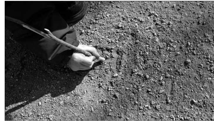
4. Écriture sur gravier.

Si les anthropologues ont ainsi focalisé l'attention sur les élèves et leur milieu, des recherches se sont orientées, après la Seconde Guerre mondiale aux États-Unis, sur « les institutions éducatives modernes », comprises comme « des phénomènes culturels à part entière et, de ce fait, susceptibles d'être abordées au moyen des méthodes classiques de l'ethnologie » [Riesman, 1991 : 223]. Ceci permet de mettre en exergue les « valeurs centrales d'une société », mais aussi d'aborder l'école « comme lieu de conflits et d'antagonismes culturels » [op. cit.]. Une ethnologie dans l'école devenait donc pertinente, mais le succès de la conception particulariste a sans doute eu pour effet d'envisager la question sous l'angle