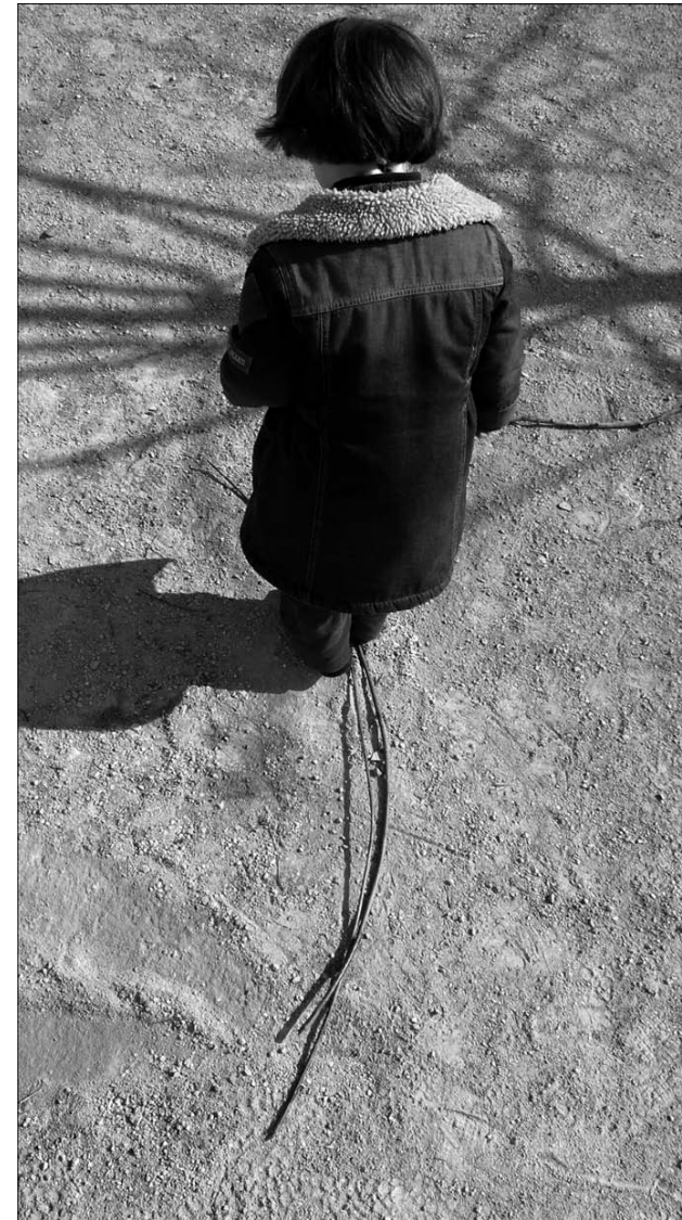
2. Perspectives et paradoxes.