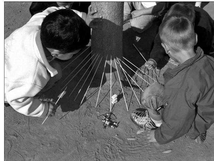
1. L'école en perspectives (© P. Laurent, 2004).

Terrain glissant... Parler d'École de nos jours, c'est prêter le flanc à des réactions immédiates. Partisans des savoirs ou de la pédagogie, de l'école sanctuaire ou de l'école ouverte, de l'autorité supérieure incontestable ou de l'autorité légitime conquise par le dialogue... les débats se cristallisent sur des oppositions franches. Dans les vitrines les plus exposées (tribunes politiques, médias), il faut choisir son camp, tant l'école fait objet de passions et d'enjeux. La même injonction peut surgir à l'échelle plus discrète du privé et du quotidien : du repas de famille au café entre amis, en passant par la discussion au salon de coiffure. Impossible, semble-t-il, après tout ce qu'on voit et ce qu'on apprend par la presse ou l'entourage, de ne pas avoir de position sur la violence à l'école, les méthodes de lecture, le voile islamique, la carte scolaire . Sans qu'on sache bien si la position qu'on demande de prendre est politique, scientifique ou morale. Les énoncés sur l'école se diffusent de telle manière et si vite que ce qui est le plus attendu est une appréciation arrêtée, sans doute déterminée – ce dont on tient rarement compte – par les souvenirs scolaires et les valeurs éducatives profondes de chacun(e). Pourtant, comme d'autres institutions aujourd'hui (pensons à la famille), l'école se caractérise par la pluralité des normes et la complexité des situations. Le phénomène est inhérent au