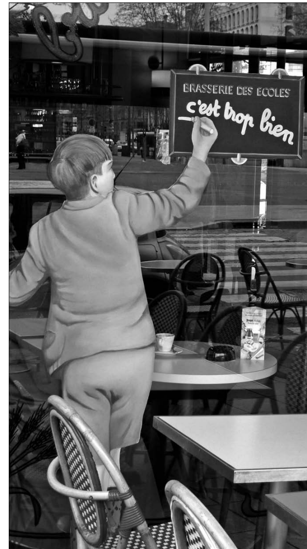
3. « Brasserie des écoles » à Lyon (photo de l'auteur, 2007).

Tout d'abord, le contexte scolaire présente deux faces antagoniques de la culture : elle est connaissance et instruction (sens didactique), ou pratique sociale et mode de vie (sens socio-ethnologique) 5 . À cette tension s'en ajoutent deux autres, héritées de