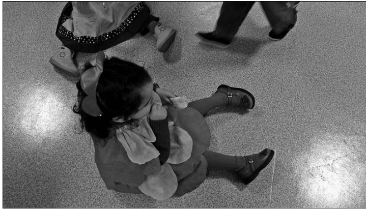
5. Carnaval en milieu scolaire (photo de l'auteur, 2005).

6. Les interactions entre l'oral et l'écrit sont au cœur de la question de l'apprentissage, qu'il s'agisse du « conte de tradition orale » [Monjaret, Provost, 2003 : 139-141] ou du « calcul mental » [Blanc, 1997].