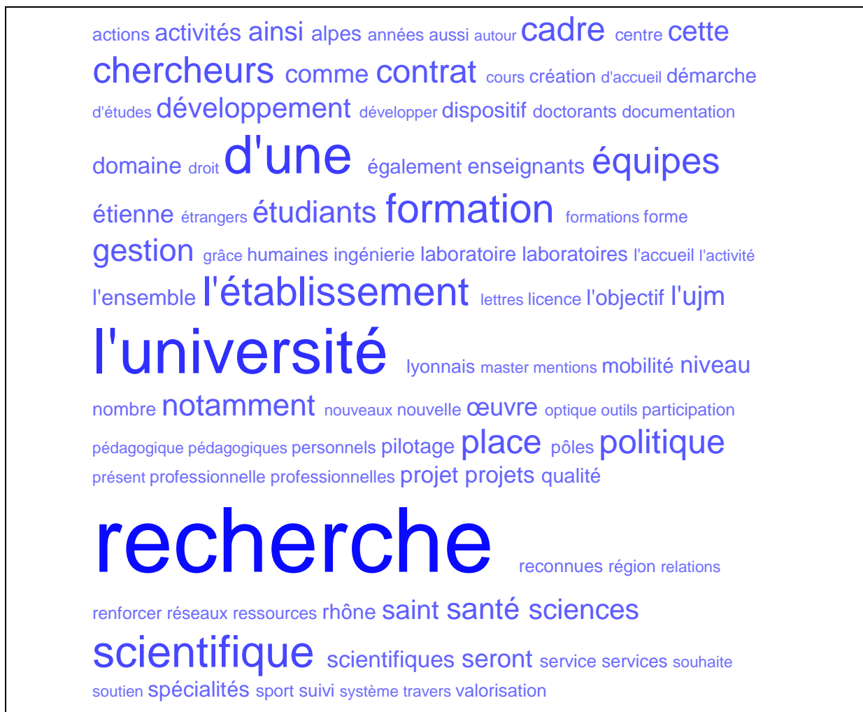
Figure 2 : Le "tag cloud" du contrat quadriennal de l'UPTM

Cette première approche, pour le moins basique, du contenu du contrat quadriennal étudié gagne à être complétée par une classification thématique plus spécifique, dont les résultats sont maintenant présentés.