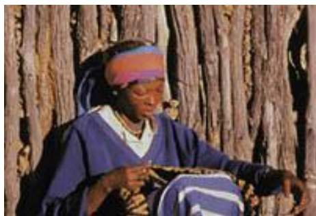
Figure 2 : L'iconographie des « petits producteurs »

http://www.info-commerce-equitable.com/artisanat-equitable.html