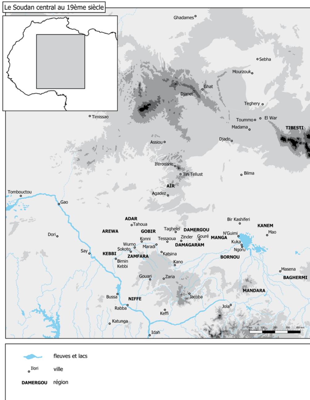
Figure 1 : Carte du Soudan central au XIX e siècle