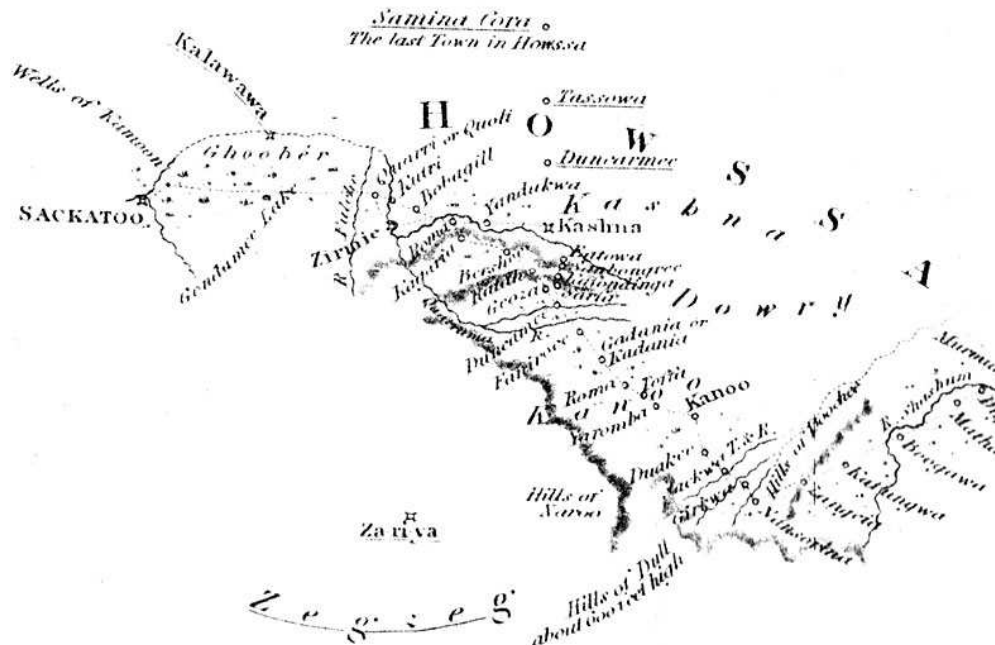
Figure 5 : Carte de la zone frontrière entre Gobir et Sokoto selon Clapperton

Détail de la carte de la mission du Bornou, in E.W. BOVILL E. W., 1966, hors-texte