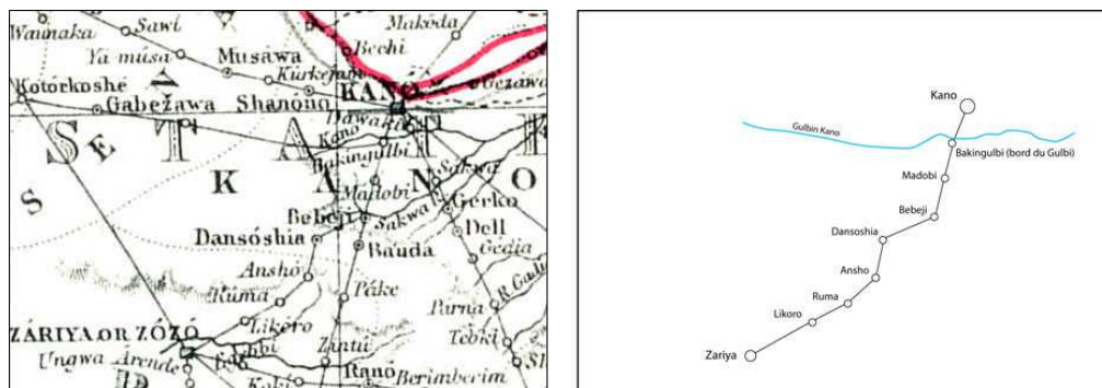
Figure 4 : Détail de la carte de Barth portant l'itinéraire de Kano à Zaria

A. PETERMANN, publié dans H. BARTH, (1857) 1965, hors-texte et Camille Lefebvre (2010)