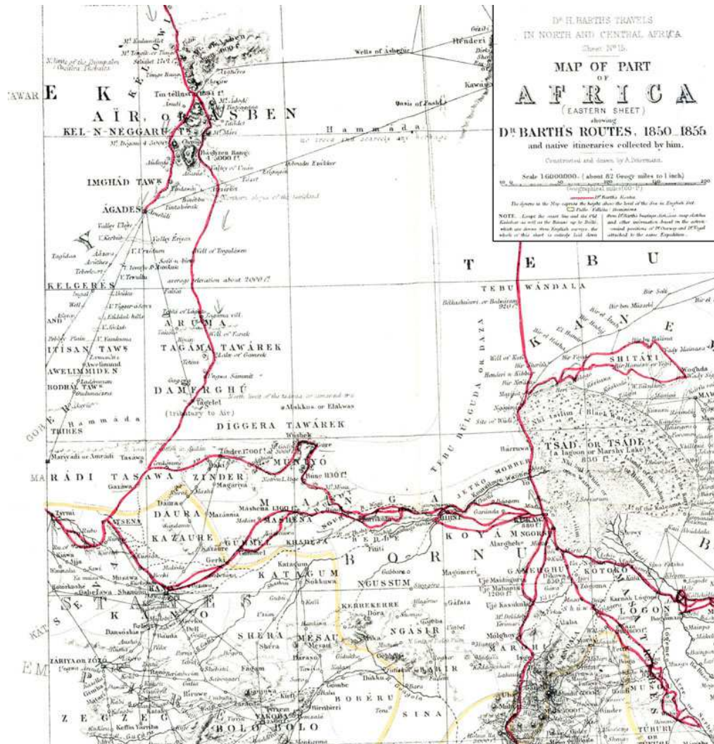
A. PETERMANN, Dr. Barth's Karte von Central-Afrika entworfen gezeichnet von A. Petermann , 1/6 000 000, Gotha, Justus Perthes, 1858, publié dans H. BARTH, (1857) 1965, hors-texte

3 Paradoxalement, c'est au regard de ce que ces itinéraires peuvent apporter pour construire une histoire de la région au XIX e siècle que ces documents se révèlent déconcertants. Composés d'informations recueillies auprès d'interlocuteurs africains, la plupart du temps locaux ou ayant voyagé sur ces routes, truffés de mots en langues vernaculaires et respectant la toponymie locale, ces itinéraires sont néanmoins traduits dans la langue de l'explorateur. Ils sont le résultat d'une sollicitation européenne et d'un entretien largement dirigé. De plus, les informations concernant le contexte de recueil sont quasiment absentes et celles concernant l'identité et la position sociale des informateurs extrêmement fragmentaires. L'extrême hybridation de ces matériaux impose donc une investigation. Au-delà d'une approche positive, qui les utiliserait pour reconstruire une cartographie des réseaux routiers existant dans la région