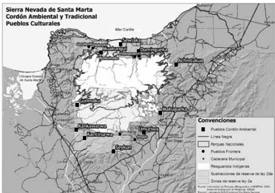
Figure 1 : Carte du « cordon environnemental de la Sierra Nevada de Santa Marta » (Fundación Pro Sierra Nevada de Santa Marta, Colombie)