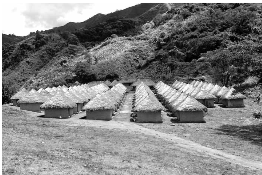
Figure 2 : Vue panoramique du village Gunmakú.