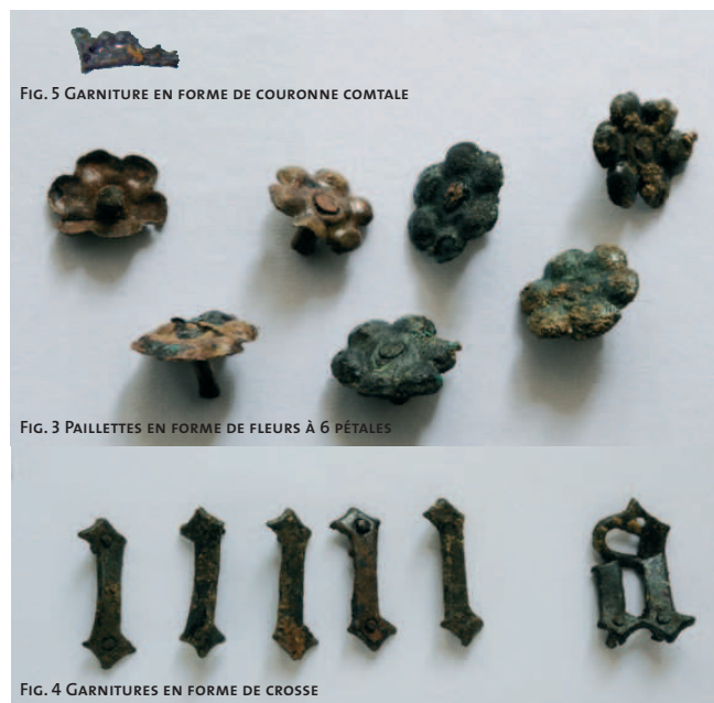
FIG. 5 GARNITURE EN FORME DE COURONNE COMTALE

Quelques monnaies, datées du XIII e à la toute fin du XVI e siècle, rappellent la période d'occupation du château.