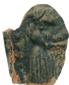
FIG. 9 NEUFCHÂTEL-MONTAIGU