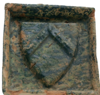
FIG. 10 GHISTELLES