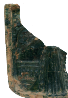
FIG. 11 BLASON ET PERSONNAGE