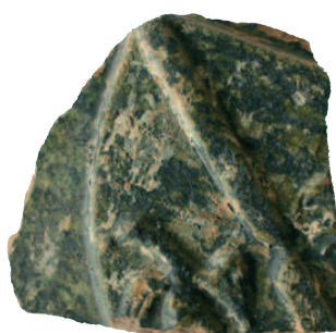
FIG. 8 PERSONNAGE FÉMININ