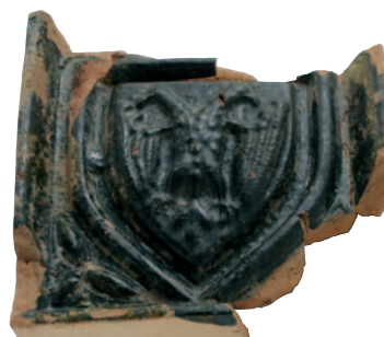
FIG. 12 AIGLE BICÉPHALE

Sur ces 25 fragments, 12 décors héraldiques différents apparaissent. En dépit de l'absence des couleurs héraldiques remplacées par la glaçure verte, quelques-uns sont rapidement identifiables. Il s'agit de l'écartelé des Neufchâtel-Montaigu : au 1 et 4 : de gueules à la bande d'argent et aux 2 et 3 : de gueules à l'aigle éployée d'argent (fig. 9), du blason des Ghistelles : de gueules au chevron chargé d'hermines (fig. 10) et de l'écu des Grandson : palé d'argent et d'azur à la bande de gueules chargée de trois coquilles d'or .