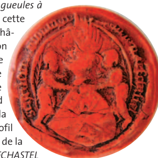
JEAN I DE NEUFCHÂTEL, SEIGNEUR DE MONTAIGU. 18 JUIN 1406 A.D. CÔTE D'OR © JC BIRQUY