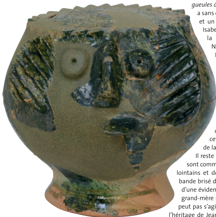
FIG. 13 ÉLÉMENT DE FAÏTAGE

pas de rejeter complètement cette hypothèse. L'autre blason, situé à la droite d'un personnage féminin (fig. 11), est probablement un écu fascé brisé d'un lambel 14 . Sa position évoque plutôt un écu d'homme mais aucun écu fascé ne semble lié à Jean I er . L'écu à l'aigle bicéphale qui revient à plusieurs reprises pose également problème si l'on cherche à identifier une famille, toutefois il peut s'agir d'une évocation de l'Empire (fig.12).