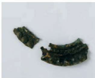
FIG. 7 ÉLÉMENTS CIRCULAIRES

petites décorations disposées en hauteur par un ou deux rivets. Les paillettes en forme de fleur à six pétales autour d'un globe central (fig. 3) sont des garnitures communes en Europe occidentale notamment aux XIV e et XV e siècles 7 . Cette cinquantaine d'éléments, de moins d'un centimètre de diamètre, sont fixés par un rivet central. Cinq autres garnitures disposent d'un