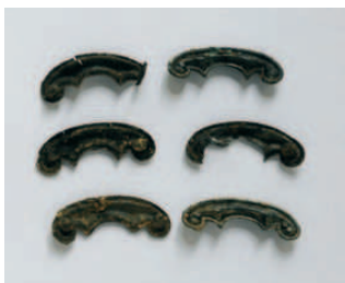
FIG. 6 GARNITURES EN FORME DE CROSSANT