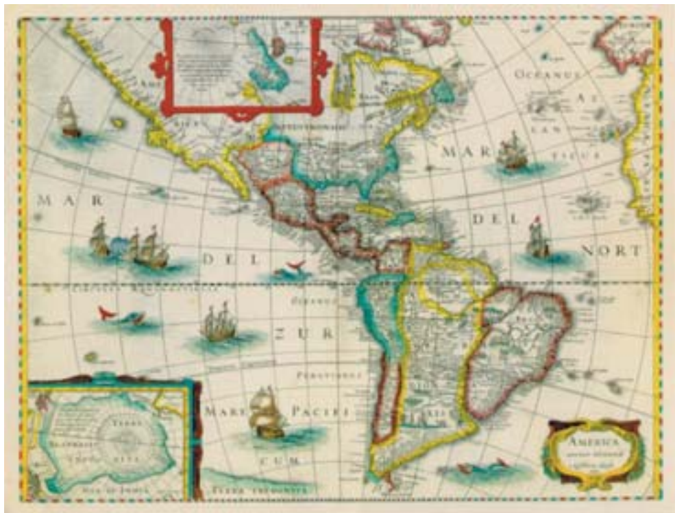
3. « America », carte d'Henricus Hondius, publiée à Amsterdam en 1631

L'œuvre de l'historien portugais Jaime Cortesão, élaborée alors qu'il enseignait au ministère des Affaires étrangères à Rio de Janeiro, se fonde sur l'étude de documents de l'époque coloniale dont une centaine de cartes anciennes (6) qui lui permettent de forger le mythe de l'île Brésil. Il démontre comment la « raison géographique d'État »,