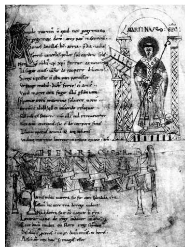
Desenhos de Bruno Baudoin, a partir do manuscrito de Londres, British Library, Add. 11662 fº 4r e 5r, (CNRS, ARTeHIS UMR 5594)

Do ponto de vista da composição geral do manuscrito, o fólio 4r se refere ao rei e ao grupo eclesiástico próximo de Saint-Martin-des-Champs (igreja, cônegos, abade, chanceler e bispo de Paris), o fólio 5r à relação estreita do santo junto ao rei no momento crucial da morte, enquanto que o fólio 5v se abre para um círculo alargado e ordenado hierarquicamente em torno do rei e consequentemente, da abadia que ele patrocina. Se o rei parece dominar a cena, a igreja São Martinho é que ocupa a posição mais alta. Porta aberta, interior basilical igualmente aberto, ela é o