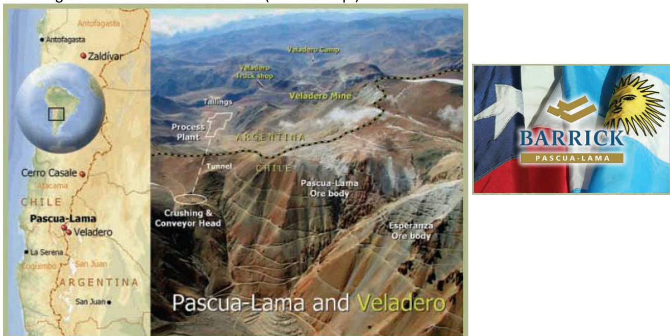
Figure 6 (a&b) : Carte de localisation transfrontalière & Logo sur fond de drapeaux chilien et argentin de la mine Pascua-Lama (Barrick Corp.)