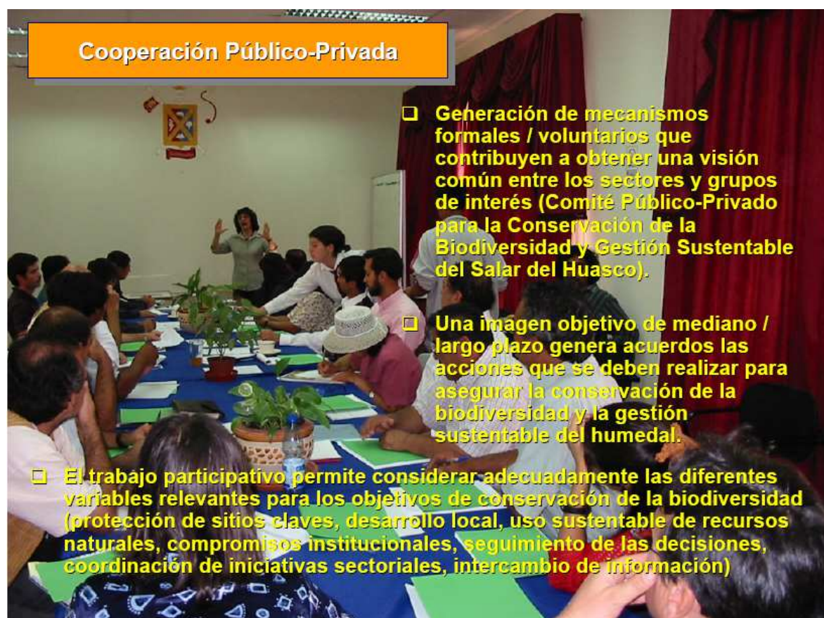
Figure 7 : Présentation du schéma d'acteurs pour la gouvernance du salar de Huasco, Chili

Revista Ambiente y Desarrollo /VOL XVIII / N° 2-3-4 / 2002