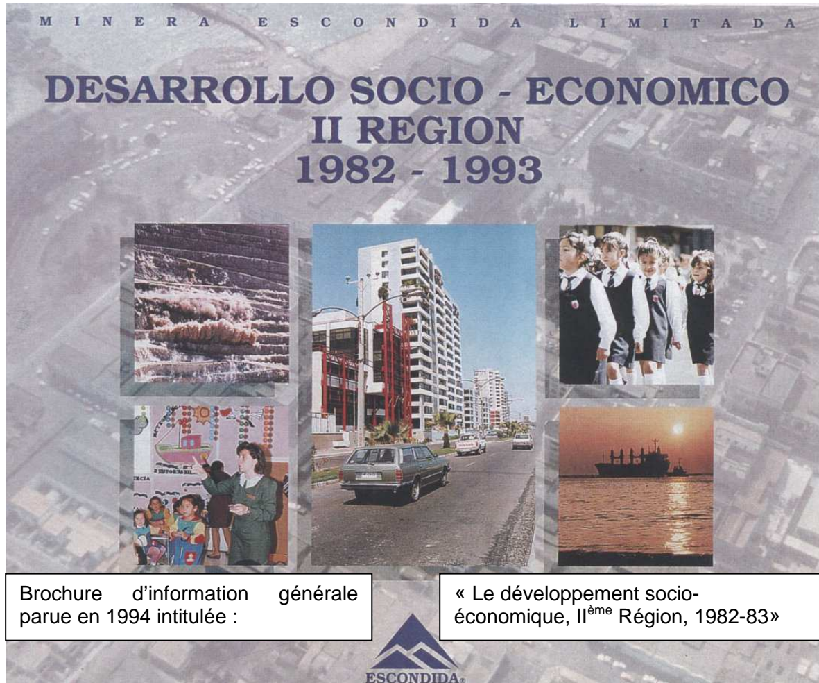
Figure 1 : Brochure d'information sur le développement régionale éditée par une entreprise minière chilienne (La Escondida, 1994)

concernée. Avant que les principes de responsabilité sociale des entreprises ne soient formalisés, la firme créée en 1996 une fondation : Fundación Minera Escondida (FME), cherchant à se positionner comme un allié durable de la population locale, au-delà de ses travailleurs, puisqu'elle s'investit considérablement vis-à-vis des populations sensibles de l'intérieur, celles des villages indigènes jusqu'alors tenus à l'écart du miracle économique chilien. C'est dans ce contexte qu'est produite une brochure remarquable, dont nous reproduisons la page de garde :