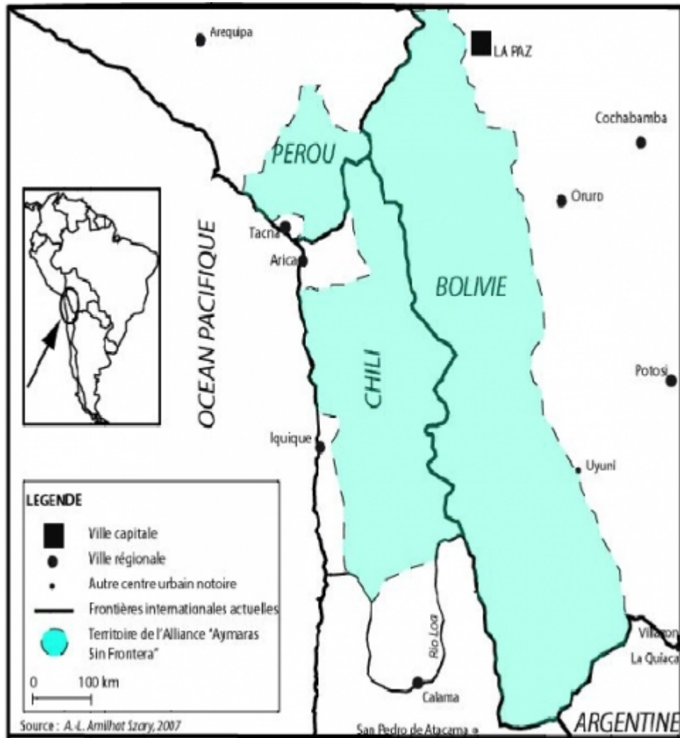
Tableau 1 : présentation du territoire trinational.