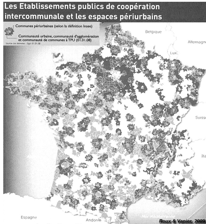
Figure 2. Superposition de la répartition de la carte des communes périurbaines (INSEE 1999) et de celle des périmètres des structures intercommunales à fiscalité propre (données Ministère de l'Intérieur, 2008), extrait de Roux et Vanier, 2009)

S'agissant des intercommunalités périurbaines, il s'agit le plus souvent de structures récentes, relativement grandes (moyenne nationale de 13 communes par EPCI) et engagées dans un processus complexe et souvent délicat de consolidation politique et technique. Il s'agit pour celles-ci tout à la fois de se constituer territorialement autour de l'idée d'un espace et d'un bien commun, mais également de se mettre en capacité d'assurer des compétences opérationnelles usuelles mais de manière désormais partagée ainsi que des missions inédites. Ces nouvelles collectivités que l'on peut alors qualifier autant de locales que de territoriales sont par ailleurs pour la plupart d'entre elles impliqués dans des chantiers de planification territoriale à grande échelle (Schéma d'aménagement, organisation des déplacements...) impliquant des acteurs nombreux et disparates (Etat, région, département, agglomération...) auxquels les communes en tant que telles n'étaient que peu ou pas confrontées.