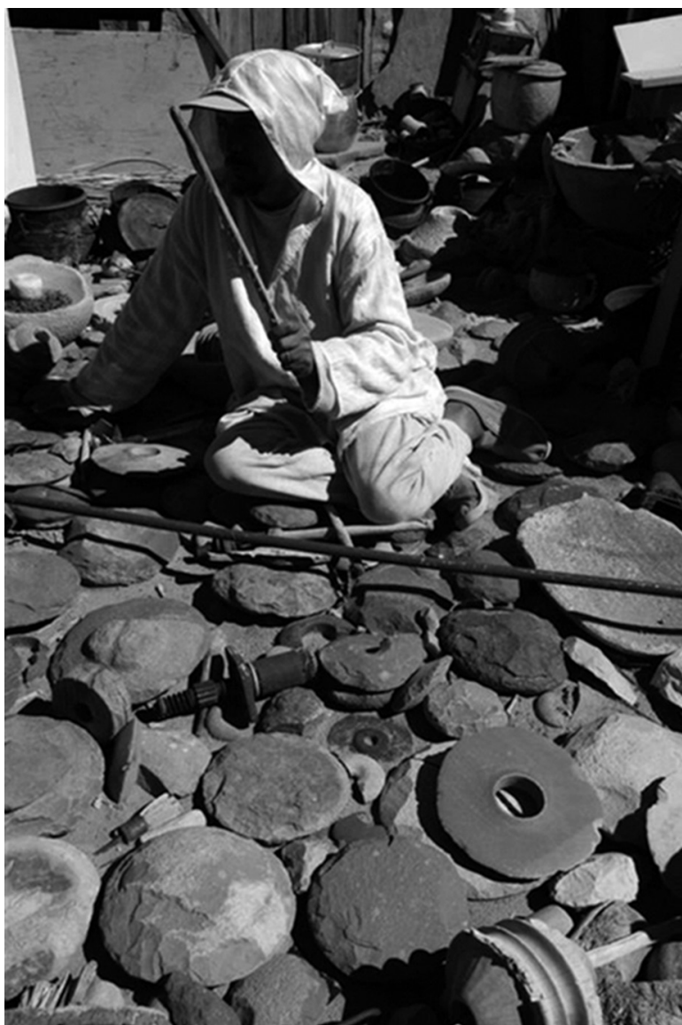
Fig. 1. Collection privée d'Attar d'où provient l'objet présenté ici.

Réalisé dans un grès beige clair et homogène, ne présentant pas de traces d'oxydation, il mesure environ 30 centimètres de long pour un diamètre de 55 millimètres. La prise en main permet de noter son caractère parfaitement cylindrique. La partie proximale offre un léger renflement, et la partie distale présente un profil en culot de bouteille profond d'une quinzaine de millimètres, quasi sphérique, lisse et régulier. La facture est nette, régulière, et dénote une main adroite ; la surface, entièrement bouchardée mais non polie, reste légèrement granuleuse.