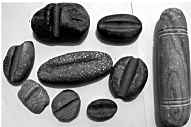
Fig. 3. Photo présentée sur le site internet du Musée de Touezekt. Remarquer la molette (?) située tout à droite.