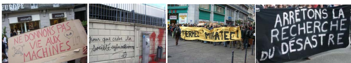
Les manifestations à l'encontre de MINATEC lors de son inauguration : « Ne donnons pas vie aux machines » ; « Pour que crève la société cybernétique » ; « Fermez Minatec » ; « Arrêtons la recherche du désastre »

Outre les risques de conflits générés par l'aggravation de la ségrégation socio-spatiale, la ville de Grenoble doit également gérer un scepticisme croissant de la société locale vis-à-vis des effets réels ou supposés des innovations technologiques 35 . La population locale de plus en plus informée, semble manifester « une aversion montante à l'endroit des risques, principalement ceux qui menacent la santé » (Filion, 2006). C'est le cas notamment de la stratégie des nanotechnologies et de l'implantation de MINATEC, qui sans véritable consultation démocratique préalable ont généré des manifestations violentes lors de son inauguration. Au niveau de Grenoble, ce débat est porté surtout par le « mouvement des simples Citoyens » qui s'opposent à la stratégie de spécialisation territoriale dans les nanotechnologies (Ferguene, 2008, p.20).