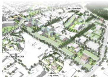
Etude pré-opérationnelle pour la requalification d'Inovalée (Meylan). INterland, 2011.