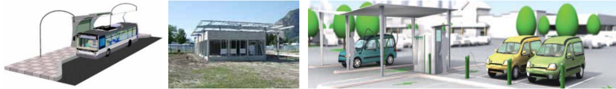
Les projets ELLISUP et Schneider Electric : développement d'infrastructures de recharge pour véhicules électriques. Images extraites des Lettres d'information du projet GIANT.

Citons également l'action pilote, déposée auprès de l'ADEME, sur les réseaux intelligents («smart grids»), visant à offrir des solutions concrètes de maîtrise énergétique auprès des consommateurs, ainsi que le programme européen d'innovation collaboratif, HOMES. Piloté par Schneider Electric, ce programme regroupe treize partenaires, industriels et acteurs de recherche, qui conçoivent des solutions pour optimiser les usages et diversifier les sources d'énergie dans les bâtiments tertiaires et résidentiels.