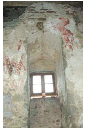
Fig. 4 : peintures à chevron ; mur sud de la tour nord ; cl. J.V.