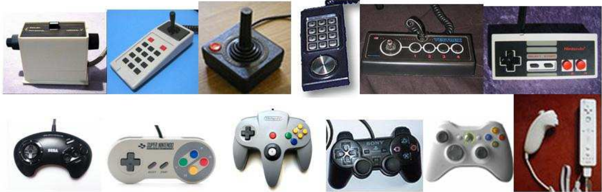
Figure 1. De droite à gauche, de haut en bas, illustration dans l'ordre chronologique des manettes des consoles : Magnavox Odyssey, Radofin, Atari 2600, Intellivision, Vectrex, NES, Mega drive, Super NES, N64, Ps2, Xbox 360, Wii.

L'histoire des consoles de jeux vidéo commence véritablement avec la commercialisation de la console Magnavox Odyssey en 1972 ([42], p 54). La manette de cette console est encore assez primitive, mais de nouvelles consoles vont très vite être disponibles. Ainsi, différents designs de manettes sont proposés jusqu'à l'apparition de la manette de la console de l'entreprise Radofin en 1976 : elle présente un levier directionnel ou stick . Cette idée sera reprise l'année suivante par la console Atari 2600 qui changera sa manette avec molette pour une manette avec un stick associé à un bouton. Durant quelques années les manettes avec disque directionnel ( Mattel Intellivision , Coleovision ), évolution des premières molettes, vont affronter celles avec stick ( Videopack , Emmerson Arcadia ). Mais en 1982, la console Vectrex apparaît : elle apporte de nombreux changements dans la conception de la manette de jeu. Son constructeur Smith Engineering veut proposer une manette avec laquelle on pourra faire l'équivalent à ce qui est faisable avec une borne d'arcade, mais il va disparaître au moment du crash du jeu vidéo