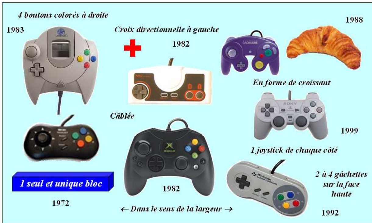
Figure 4. Prototype de ce qu'aurait pu être une planche de routines réalisable dès la fin 2001 concernant le design d'une manette de console.

La mise en place d'une veille créative fondée sur la collecte et l'analyse de signaux de routines nécessite donc une analyse rétrospective des routines passées afin d'identifier le pourcentage d'innovations multicritères acceptables et susceptibles de donner une longueur d'avance aux concepteurs. Ce pourcentage est bien sûr à mettre en