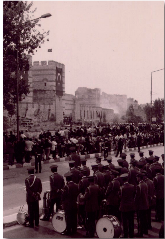
Figure 4 : Communication sur les cérémonies dans le bulletin municipal