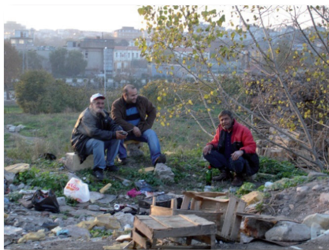
Figure 6 : maraîchage entre les hauts murs près de Yedikule