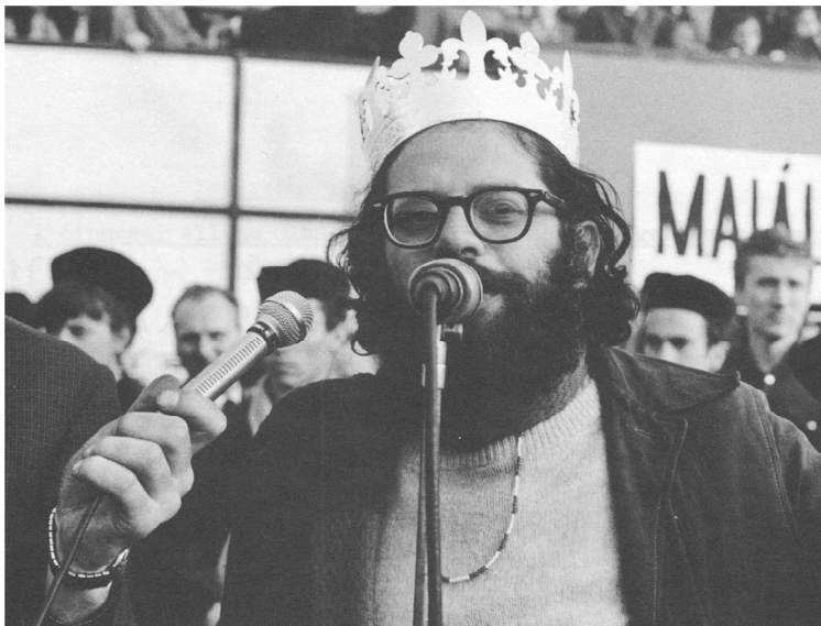
Allen Ginsberg juste après son élection roi de Majáles