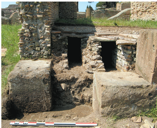
Fig. 21 – Ostie. Grandi Horrea , angle sud-est de l'espace 23. Vue des suspensurae en écorché.

long espace correspondant aux pièces 88 à 93. Une série de douze nouvelles cellae (espaces 74-79; 81-86) s'ouvre sur ce qu'il faut considérer comme un couloir d'accès et de distribution (espace 80). Dès leur construction, ces pièces disposent d'un sol surélevé (fig. 20, type B). Les observations réalisées dans l'espace 83 montrent que le système adopté comprend cette fois seulement trois canaux centraux larges de 40 cm, disposés dans le sens longitudinal de la pièce et délimités par des murets en briques hauts de 60 cm et larges de 45 cm. Vers le milieu de la pièce, une saignée perpendiculaire permet à l'air de circuler entre les différents canaux. Contrairement au type A, les canaux du type B ne sont pas alignés avec les deux ouvertures disposées sous le seuil; le renouvellement de l'air est toutefois assuré. Le sol est aménagé d'un seul lit de bipedales recouvert de béton de tuileau. Cependant, des encoches régulièrement espacées (60 et 80 cm) ont pu être observées à la base des murs latéraux de la pièce. Le même système a pu être étudié sur l'ensemble des espaces 74-79 et 81-86 : il indique que ces cellae du secteur septentrional étaient toutes pourvues d'un plancher reposant sur un sol surélevé, déjà aménagé d'un pavement en béton de tuileau.