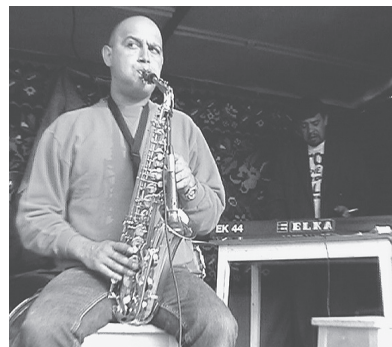
à gauche: Section harmonique d'une fanfare.