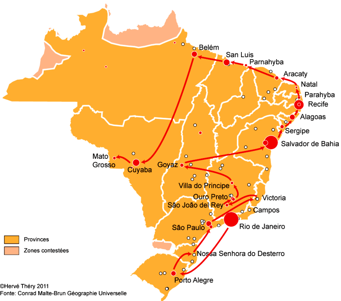
Figure 1 Le parcours de la description régionale

On n'évite toutefois pas un certain préjugé en faveur des régions tempérées: « Sous un ciel tempéré, le sol est si productif, qu'on pourrait appeler le Rio-Grande le grenier du Brésil ». Le préjugé semble même distordre un peu la réalité, « la température des environs de Saint-Paul permet aux fruits de l'Europe d'y venir; les cerises surtout y abondent. Ce point paraît offrir le meilleur climat de tout le pays ». Cela surprend un observateur du XXI e siècle, car la ville de São Paulo est située sur le Tropique, et aujourd'hui le Brésil ne produit plus de cerises (il les importe du Chili). Il en va de même pour un autre fruit, le texte indique que les « pamplemousses [...] » sont communs sur la côte », ce qui n'est plus le cas aujourd'hui, au point que le fruit n'est plus commercialisé au Brésil, où son goût amer n'est pas apprécié (il n'y a même plus de nom). De même on est étonné de lire que « le cacaoyer forme des forêts immenses dans la province de Para, le long du Madeira, du Xingu et du Tocantins ». Ces forêts ont-elles disparu, ou était-ce l'un des mythes qu'une connaissance plus complète de la région a dissipés?