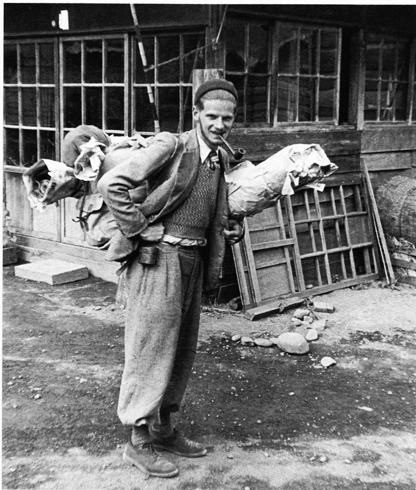
André Leroi-Gourhan au Japon entre 1937 et 1939

P aléontologue pour les uns, ethnologue, préhistorien, anthropologue des techniques pour les autres, André Leroi-Gourhan est pourtant un autodidacte qui a quitté l'école à 14 ans.