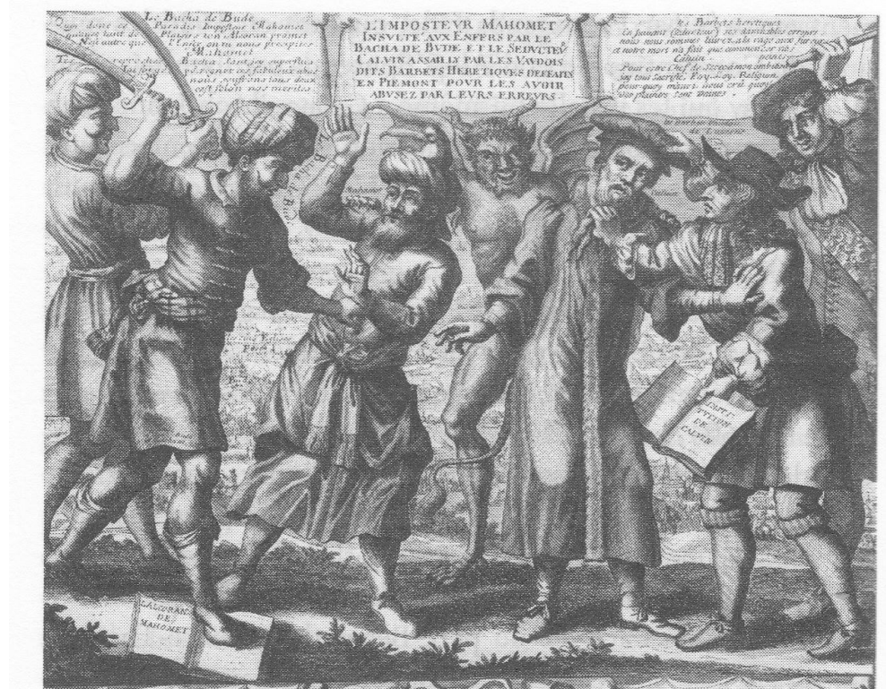
3. Mahomet l’imposteur et Calvin le séducteur aux enfers, dans un almanach du 1 er janvier 1687

C’était de bonne guerre, si l’on peut dire, et les catholiques n’allaient pas se priver de l’outil: ils renvoient dos à dos les grands hérésiarques : Mahomet, Luther, Calvin.