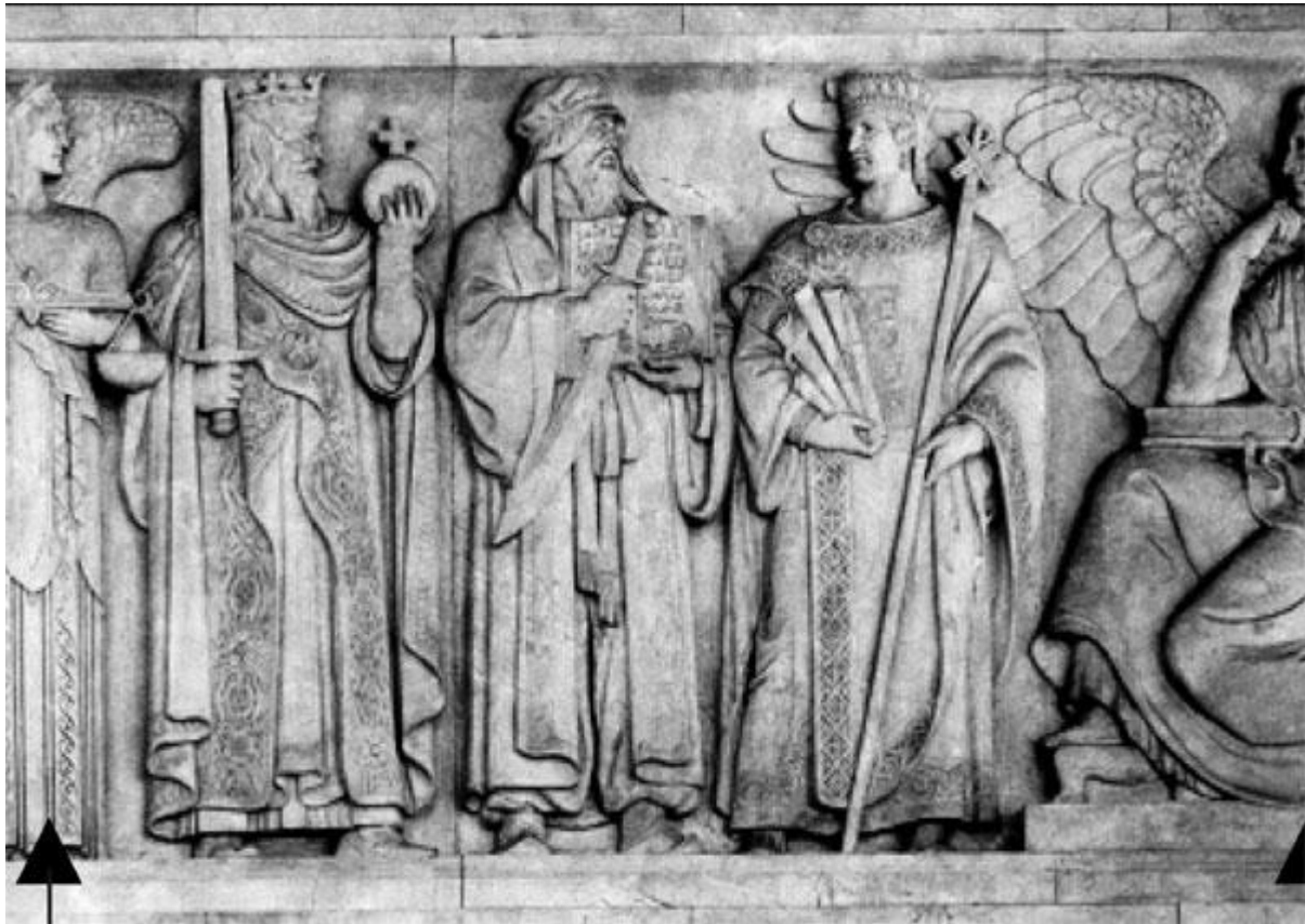
4. Muhammad entre Charlemagne and Justinien; frise par Adolph A. Weinman. Washington: US supreme court (1935).

Adolf A. Weinman, sculpteur américain né en Allemagne, donne une expression visuelle de Muhammad législateur dans la frise qu'il fit en 1935 dans la salle d'audience de la cour suprême des USA. Le prophète figure parmi les dix-huit grands législateurs honorés, qui vont de Hammurabi jusqu'à John Marshall, juge à la cour suprême, en passant par Moïse, Confucius et Napoléon. Muhammad tient un Coran ouvert dans sa main gauche et dans la droite une épée (comme c'est le cas pour de nombreux législateurs dans la frise).