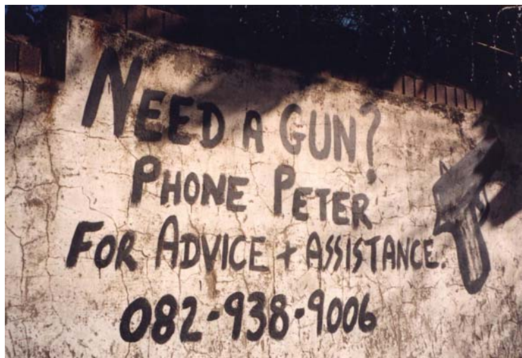
1 - Editorial éphémère - Hillbrow, Johannesburg, (Gauteng)