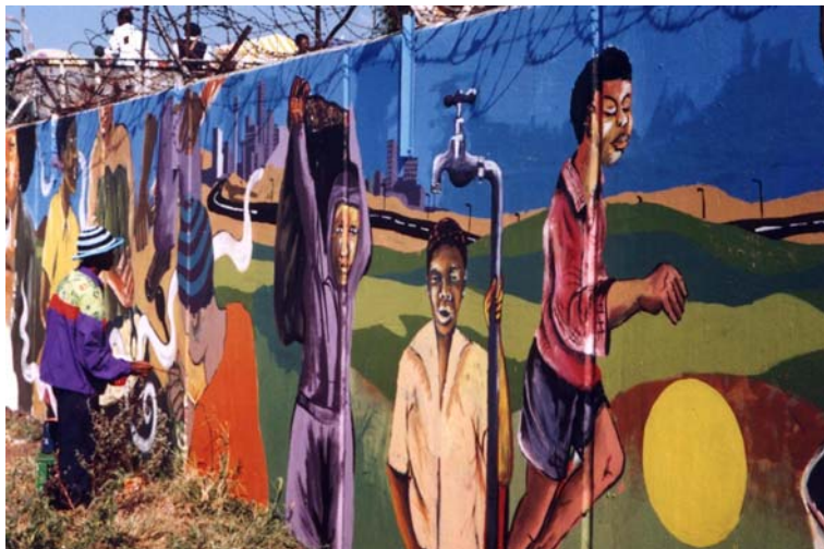
11 – Géographie de l’apartheid - Soweto (Gauteng)