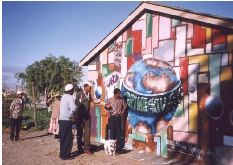
2 - La prévention de la criminalité : campagne locale et mise en perspective planétaire.

Mais depuis les années 1990 1 , le territoire sud-africain est en reconstruction. L’exil intérieur infligé aux populations, puis la liberté de déplacement retrouvée sont probablement déterminants dans la volonté de se réinscrire à plusieurs échelles : locale dans des valeurs individuelles ou communautaires, mais aussi continentale, voire mondiale (photo 2). Les aspirations à cette triple reconstruction identitaire se révèlent bien dans les représentations picturales urbaines, spontanées ou commanditées : paysages, scènes de vie et cartes de géographie. Peintres d’un jour ou de longue date, simples animateurs culturels peignant depuis leur communauté et pour elle ou équipes multiraciales se déplaçant au hasard de la demande, tous exposent en permanence sur les murs des villes. Graffiti et graphes signent les éditoriaux d’un jour et, de quelques mots à l’aérosol, font écho aux préoccupations du lieu ou... du monde. Ces quelques images 2 , glanées lors d’une longue errance en Afrique du Sud, dévoilent les nouvelles relations que les Sud-Africains entretiennent avec leur territoire, leur continent ou leur planète.