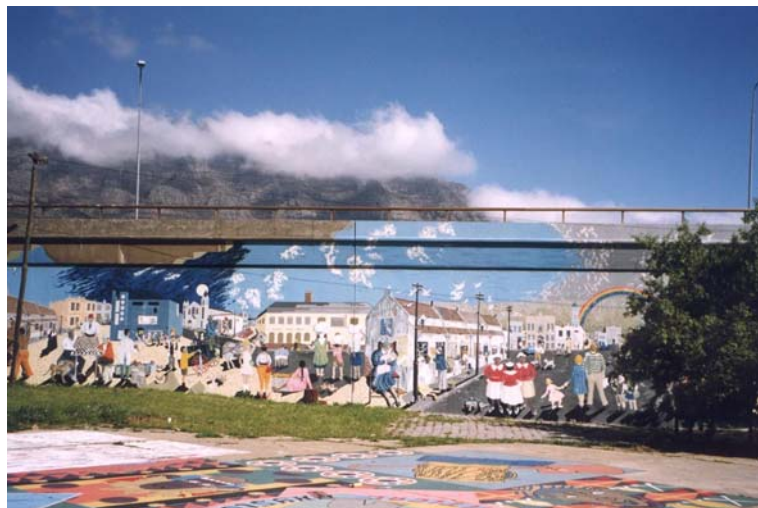
9 – District Six revisité - Zonnebloem, Le Cap (Western Cape)

Organisé par la Fondation Gérard Sekoto et la société De Beers.