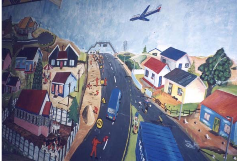
10 – Lieux et liens - Umlazi, Durban (Kwazulu Natal)