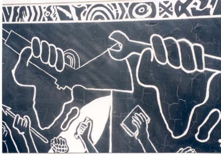
21 - Des travers aux droits de l’homme : cartographie