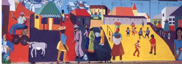
8 - Sophiatown revisité - Westdene, Johannesburg (Gauteng)

n’est pas seulement nostalgique. Il témoigne aussi d’un futur possible pour l’Afrique du Sud.