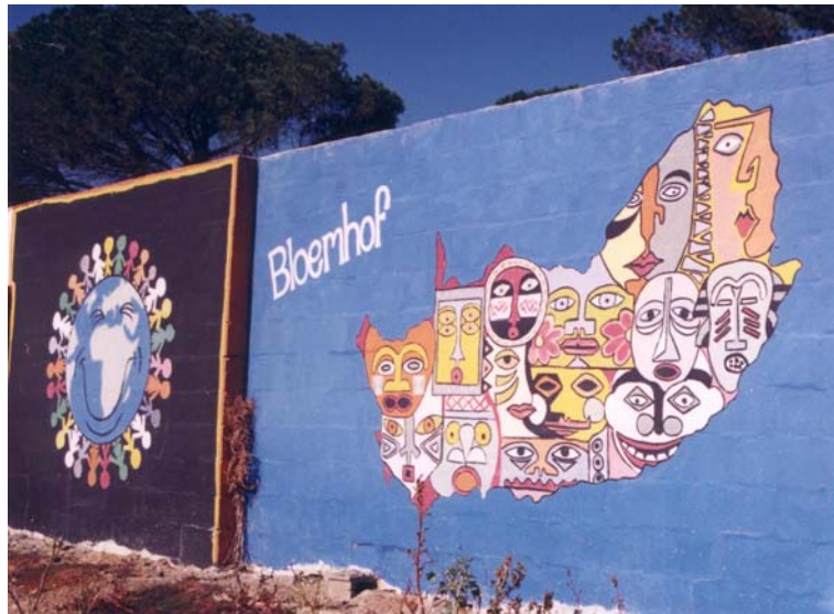
13 – L’Afrique du Sud multiraciale,