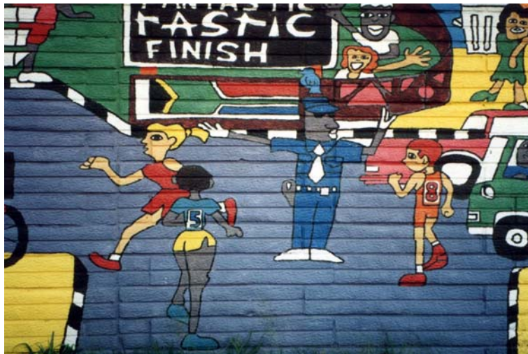
24 – « Anticipation ou utopie ? » : détail d’une publicité pour une marque de riz - Soweto (Gauteng)

Ils font le pari de croire en des jours meilleurs pour l’Afrique et en un destin commun pour les Sud-Africains. A grands traits de pinceaux et à grands jets de bombes aérosols, Ils lancent un débat au cœur des espaces habités : dans quel monde, dans quel pays, dans quelle ville, les Sud-Africains veulent-ils vivre ? Tout est possible. La route -métaphore du déplacement et du passage- peut devenir le lieu de nouvelles sociabilités. Quand verra-t-on à Soweto une jeune femme blonde jogger en toute sécurité? (photo 24)