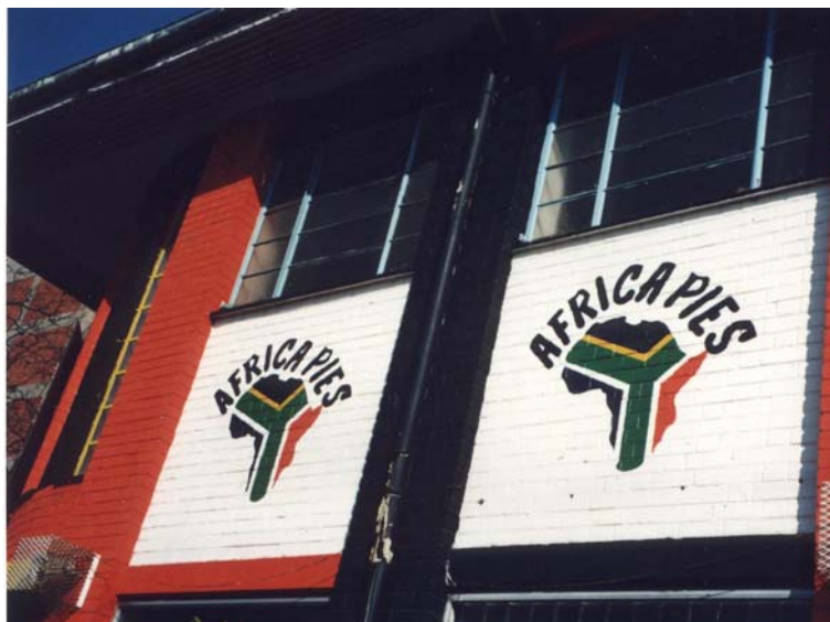
19 – Africa Pies : Afrique du Sud = Afrique ?

Pour vendre des pâtés en croûtes (photo 19), des matériaux de construction, des livres ou des pièces détachées de voiture... mais aussi pour décliner leur raison sociale, leur adresse et leurs coordonnées, de nombreuses entreprises usent (et abusent) de la carte du continent africain, souvent associée aux couleurs du drapeau (Maake- 1996), à sa géométrie particulière et à ses six couleurs qui recouvrent, très souvent, l’intégralité du continent... renvoyant ainsi au logo et au slogan de la campagne commerciale « Proudly South African » !