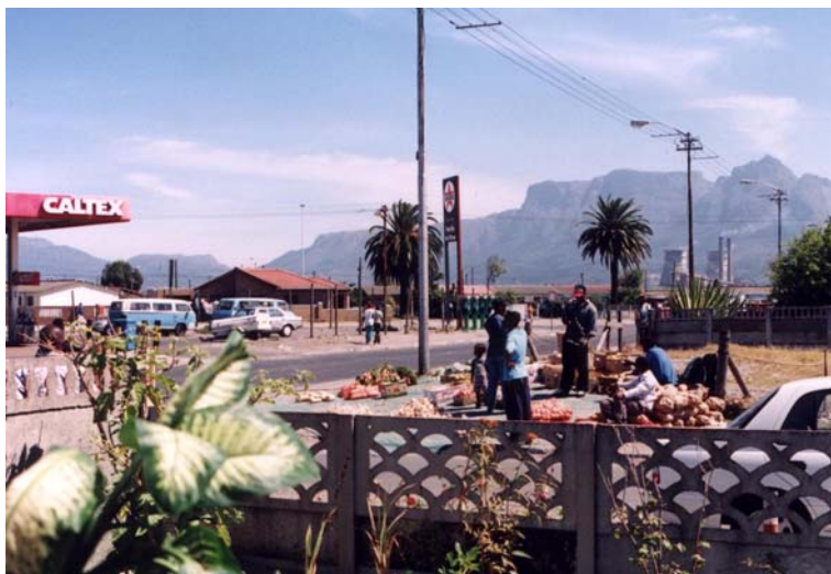
5 – La montagne de la Table et les tours de refroidissement de la centrale thermique de Langa

Rares sont les reliefs qui accrochent l’œil, à l’exception notable de la montagne de la Table (Vergunst, 2000) au Cap et des tours de refroidissement de centrales thermiques dans les principales villes (photos 5, 6 et 7). Les peintures murales mettent en scène ces hauts lieux et les décors familiers. Le mur sert de miroir, fidèle ou déformant selon les cas.