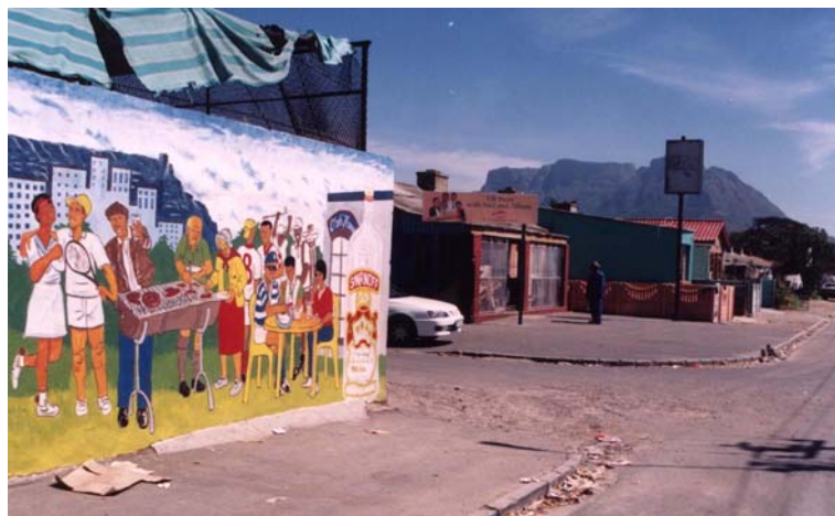
7 – La montagne de la Table et son double, Langa