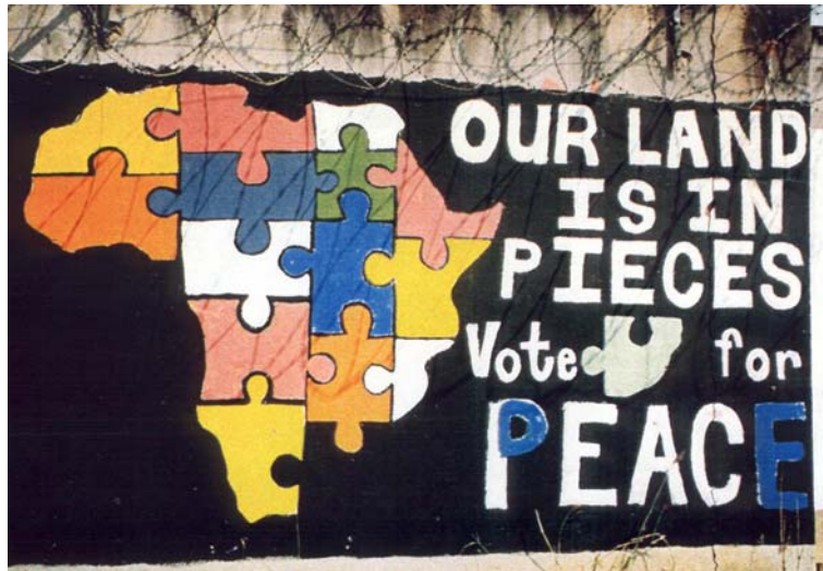
17 - Pietermaritzburg, (KwaZulu Natal)

L'Afrique constitue donc un mythe-fondateur, un point de repère pour construire une identité globale (Brink, 1998). Représentée de cent façons différentes, l'Afrique illustre bien cet espace symbolico-mythique qui donne l'occasion, à des populations encasernées, de voyager dans un imaginaire collectif! Africa My Music ! (Mphahlele, 1984)