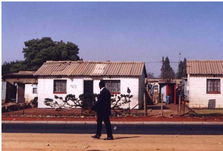
3 – Maisons boîtes d’allumettes

Conçus sur un modèle spatial qui s’apparente au labyrinthe, disposant d’un nombre limité d’entrées et de sorties, les townships sont encore autant de huis clos. Leur direction n’apparaît guère sur les panneaux de signalisation. Leur localisation sur les cartes routières, reste aléatoire 6 ! Mal renseignés sur le terrain, ne figurant pas toujours sur les cartes, souvent très étendus, les townships sont des lieux où il est facile de s’égarer. L’expérience du terrain et la lecture des cartes révèlent encore la persistance de deux Afriques du Sud (Human Rights Commission, 1992).