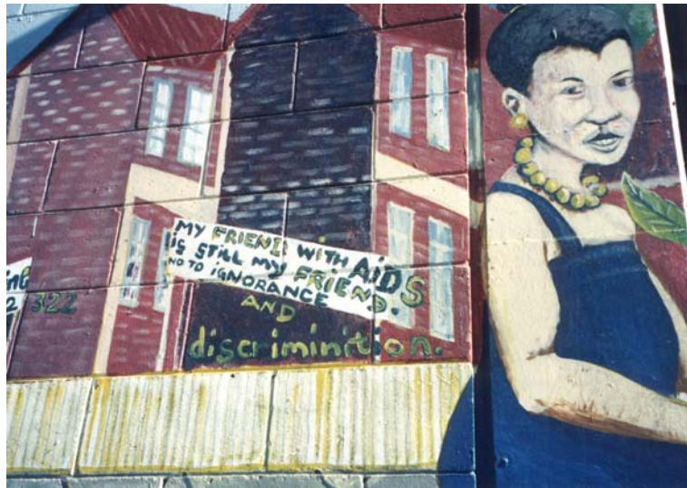
12 - Mise en contexte des messages