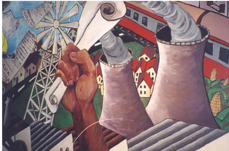
6 – Les tours de refroidissement revisitées, Maison des Syndicats, Salt River