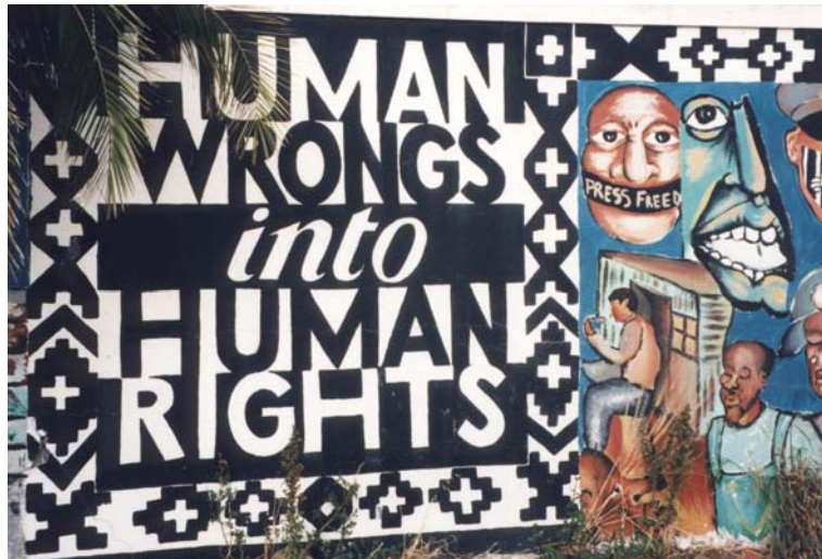
20 – Des travers aux droits de l’homme : mots