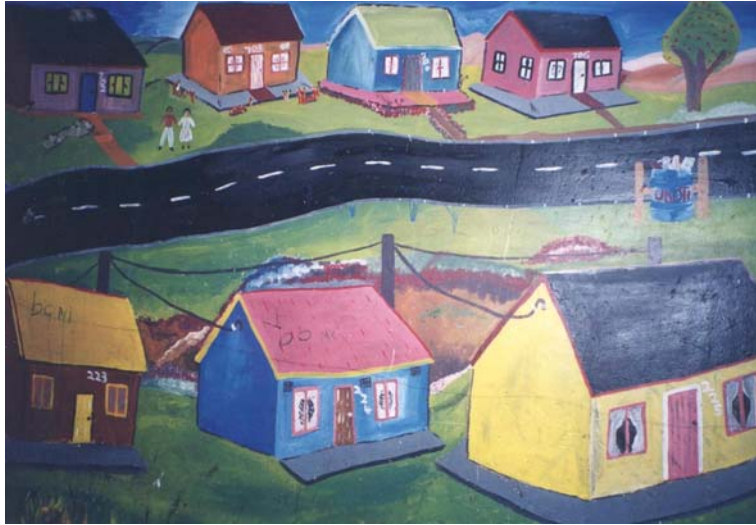
4 – Maisons boîtes d’allumettes revisitées