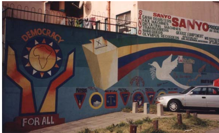
18 - Démocratie pour tous : une Afrique sans frontières