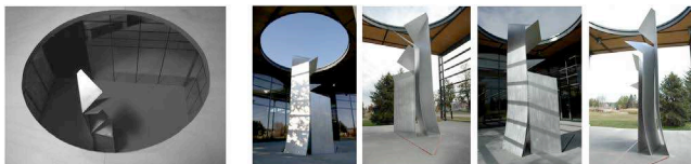
Figure 3. Le fil, 2008, Karole Biron, Œuvre d'intégration à l'architecture, Bibliothèque Félix Leclerc, Québec