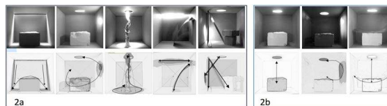
Figure 2. Ex. analyse spatiale; principaux éléments d'attention visuelle

La mise en commun de quelques analyses spatiales souligne dans une certaine hiérarchie, le sens de lecture potentiel ou estimé entre les éléments visuels dominants (figure 2a). La représentation graphique à l'aide de flèches marque le parcours du regard. Elle synthétise les actions concertées ou non des éléments présents. La force de certaines images est principalement due au renforcement mutuel entre lumière et objets, lorsque ceux-ci concordent formellement. La lumière exerce une grande importance sur l'attention visuelle. La modification de son intensité ou de l'angle d'éclairage, par exemple, transforme complètement la lecture des volumes. La figure 2b montre des ambiances lumineuses évoquant une certaine dématérialisation visuelle de l'objet par la lumière pour une organisation spatiale constante.