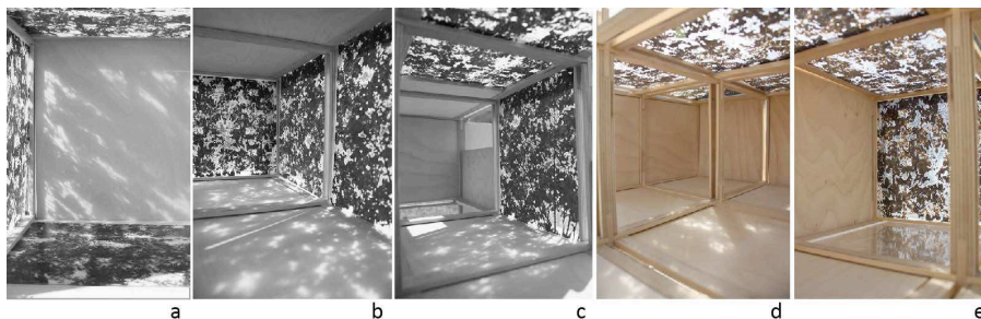
Figure 3. Explorations en maquettes intégrant plusieurs plans végétaux

Tirant profit de l'approche tactile, les explorations intègrent facilement plusieurs plans végétaux opaques ou transparents dans un même espace simulé, multipliant les possibilités de configurations spatiales et visant l'enveloppe architecturale au sens global. Les modulations complexes de la lumière augmentent la perception de l'espace dans les images 3a, 3b et 3c, déployant des ambiances intérieures et extérieures qui s'entremêlent sous un soleil direct. Les filtres verticaux en périphérie se projettent de toute part, dilatant le sol et les parois opaques. Pour sa part, le plafond végétal traversé par la lumière zénitale agit comme un plan translucide et diffuseur (figures 3d et 3e). Enfin la maquette permet de tester des jeux de reflets par l'introduction de surfaces réfléchissantes (figure 3e), qui mettent de l'avant la qualité fluide et fluctuante de la lumière et du végétal dans l'espace, brouillant les frontières. Elles peuvent donner lieu à une interpénétration visuelle des plans.