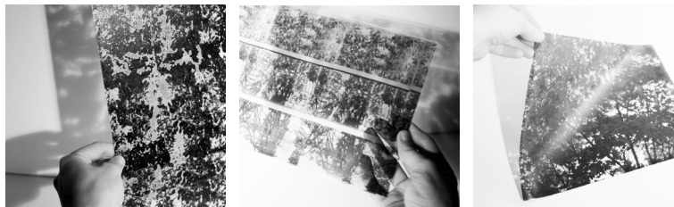
Figure 1. Simulation du végétal par images imprimées sur supports transparents

L'une des méthodes retenues pour la recherche est la simulation du végétal par l'image imprimée sur support opaque ou transparent. Celle-ci consiste à sélectionner la photo d'une espèce végétale correspondant aux critères du concepteur et à l'imprimer sur un médium qui au besoin laisse passer la lumière (voir figure 1). Bien que la texture du végétal en soit aplatie, cette opération simple permet de travailler facilement avec un certain niveau de complexité en termes de géométrie du feuillage et des ramifications, correspondant à une espèce végétale précise. La manipulation de ce « plan végétal » est aussi grandement facilitée lorsqu'on la compare aux autres matières disponibles pour la maquette – mousses, lichens et feuillages textiles ou plastiques –, que l'on doit inévitablement fixer pour composer un plan ou un volume, non sans difficulté. Les options d'impression permettent en outre d'obtenir une transparence et une densité précises pour l'imprimé végétal, sur une variété de supports maniables, opaques ou transparents (acétate, plexiglas , film statique, etc.).