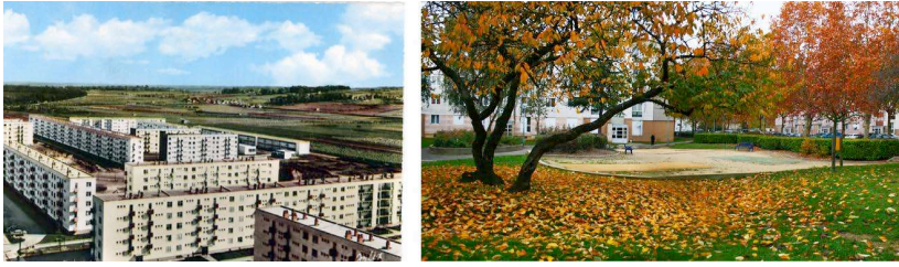
Figure 1. À gauche, le grand ensemble ou l'image de la ville moderne à la campagne, quartier Beauregard, Poissy, architecte C.G. Stoskopf, 1956-58. http://archipostcard.blogspot.fr/2009_05_31_archive.html . A droite, le quartier Beauregard aujourd'hui. Source Arnaud Hollard

Il s'agit donc dans un premier temps d'actualiser la connaissance du lieu, de mettre au jour ce qui s'est renforcé ou dissout avec le temps, plus généralement tout ce qui échappe à la pensée typo-morphologique, largement convoquée dans le contexte des opérations de renouvellement urbain. Apparaissent alors des qualités spatiales et ambiantales qui donnent à chaque grand ensemble un visage particulier, et qui jouent aussi, à un niveau plus fin, comme facteur de diversité au sein d'un même ensemble. Le grand ensemble devient alors porteur de certaines qualités qui lui sont propres et que l'on ne peut retrouver dans aucune autre forme d'habitat (individuel, petit collectif, etc.), qu'il s'agit de valoriser et d'associer aux objectifs généraux du renouvellement urbain (introduire de la mixité sociale, fonctionnelle, économique, réduire les facteurs d'enclavement, etc.).