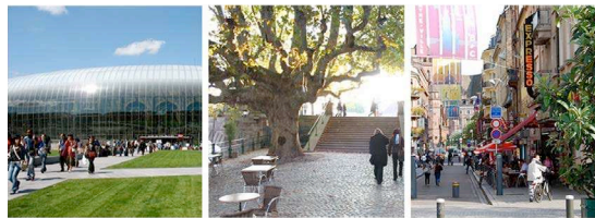
Figure 2. De gauche à droite : atmosphère de la gare, « À l'arbre tu tournes à gauche », la rue Maire-Kuss essentiellement connue sous le nom de la « rue des Kébabs »