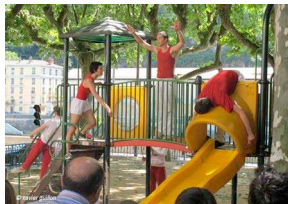
Figure 4. Le jeu-instrument

L'ambiance du square de la place de la Butte peut se résumer à un moment participatif intense où le public extériorise le mouvement, où la danse transmet le plaisir de braver les interdits et de voir danser un jeu d'enfant. Mais qu'est-ce qui, à ce moment précis, pousse le public à entrer dans l'ambiance ? Est-ce le désir toujours présent d'une rupture du quotidien, de faire du bruit dans l'espace public, de s'autoriser collectivement à transgresser un jeu d'enfant ? Comme si cette ouverture de l'ordinaire vers des expériences inconnues conduisait directement au plaisir, petites occasions de liesse collective dominées par l'émergence d'une ambiance sonore très intrusive.