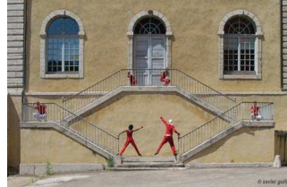
Figure 6. Figure de symétrie

« Le danseur n'occupe pas l'espace, il s'en préoccupe. » 12