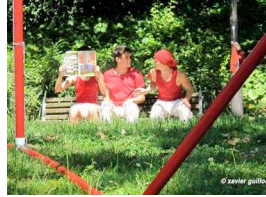
Figure 2. Variations sur un banc

l'extraordinaire 7 , les gestes répétitifs, les déplacements en groupe prélevés de démarches de rue, décalent la perception d'espaces ordinaires connus. 8