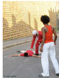
Figure 3. Corps sur asphalte

« La danse est une forme de déconstruction de ce que nous croyons savoir sur le corps, c'est un processus de dévoilement où le corps se révèle sensible (plutôt qu'objectif et homogène), précisément parce qu'il est vécu comme instable et aléatoire. » (Guisgand, 2011) 9