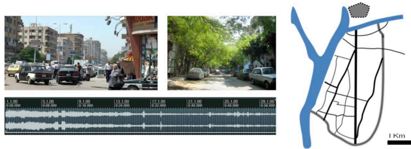
Figure 2. Le sonogramme montre la transition sonore et l'effet de fondue-enchaîné entre le boulevard de Choubrah et une rue résidentielle.