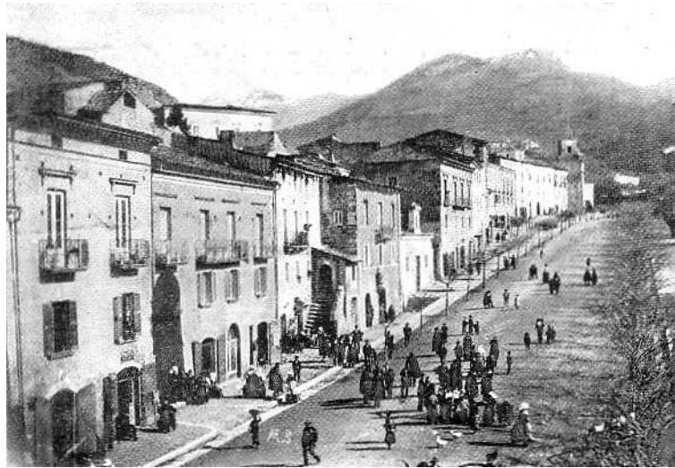
Roccasecca en 1903