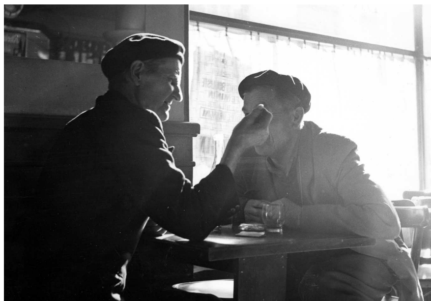
Hommes au bistrot, collection BM Lyon