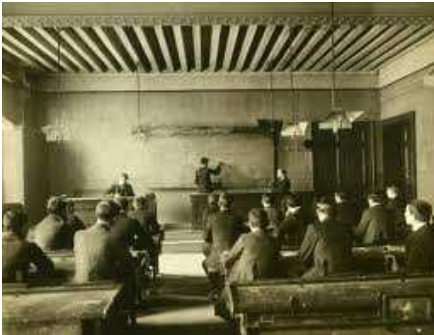
Une classe à l'École de la Martinière des garçons, vers 1930

De plus, tous signalent la même facilité pour trouver du travail à la sortie des études. Le contexte économique très favorable permettait cela. Cependant, on aurait pu s'attendre à des discriminations, or, on constate qu'il n'en n'est rien. On observe une bonne insertion sur le marché du travail. Les enfants émigrés n'ont pas spécialement plus de problème pour travailler : Pio Gaveglia : « J'ai commencé à travailler à la sortie de l'école. A l'époque les usines venaient plutôt faire des propositions d'embauche. Eh oui, c'était la bonne époque (Rires). » ; Angela Marciano : « [...]je me rappelle, y'avait une prof, la prof de français qui est venue dans la classe et qui a dit : « Qui veut travailler cette été ? » Et donc on ne savait même pas les résultats des examens, et moi j'ai levé la main et j'ai dit : « Moi je veux bien travailler. » Et donc je suis allée travailler à l'imprimerie Arnaud à Villeurbanne [...] » ; Angèle Santoro : « Et puis j'ai trouvé du travail tout de suite après. Je ne l'ai même pas eu mon CAP en fait. J'ai passé l'examen le vendredi et le lundi j'avais un travail. Ils m'ont jamais demandé si je l'avais eu ou pas, mon CAP. A l'époque il y avait du travail, pas comme maintenant. » Ainsi, globalement, tous ont connu une assez forte mobilité sociale par l'intermédiaire des études qu'ils ont suivies, Arthur Derderian représentant le meilleur exemple de mobilité sociale grâce au parcours scolaire.