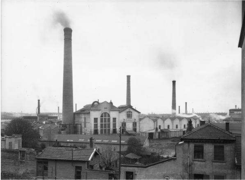
L'usine textile Gillet/SASE à Villeurbanne(1930)