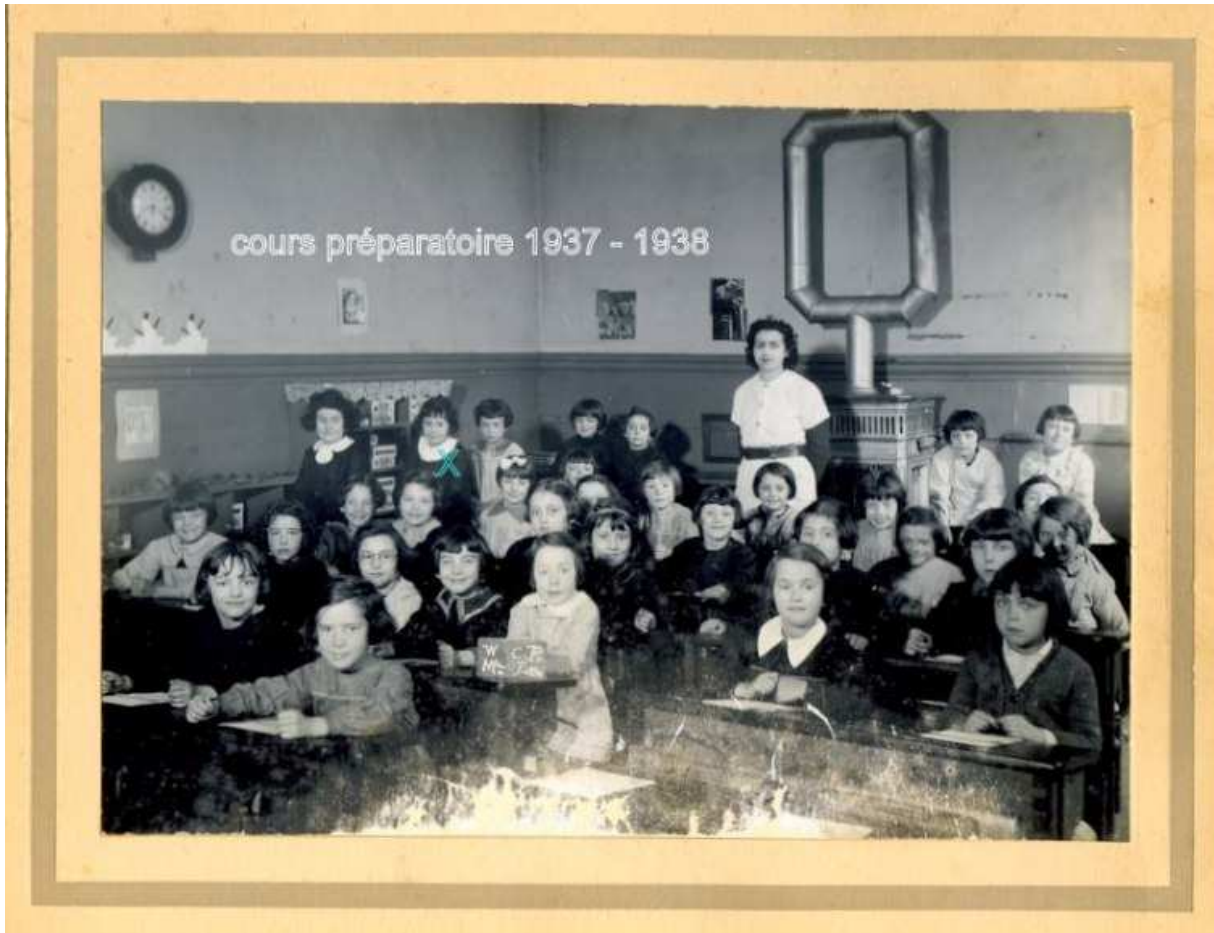
Une classe de CP dans une école de filles, 1937