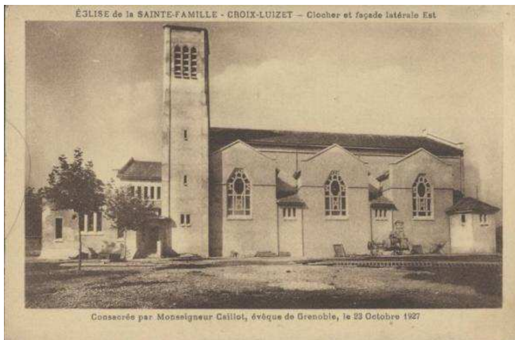
L'église de la Sainte-Famille, quartier de la Croix-Luizet à Villeurbanne