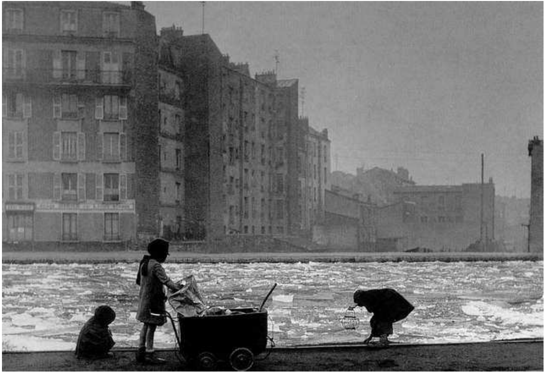
Robert Doisneau, Série « les glaneurs de charbon », 1945

Le salaire n'est donc pas le seul moyen de subvenir à ses besoins même si trouver un travail relevait, dès l'arrivée de la plus grande nécessité.