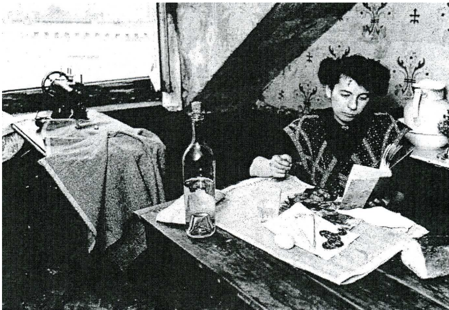
Une couturière à domicile, vers 1920