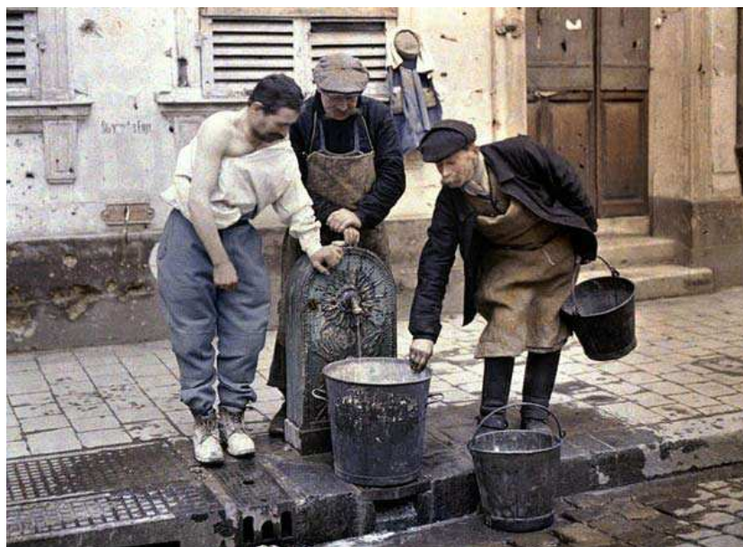
Fontaine publique, 1917