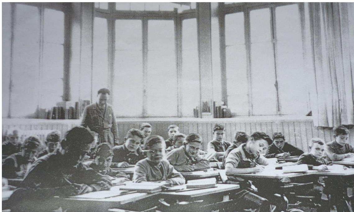
Une classe d'école primaire de garçons, vers 1960