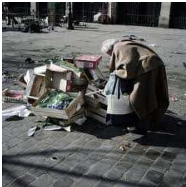
Glanage sur un marché