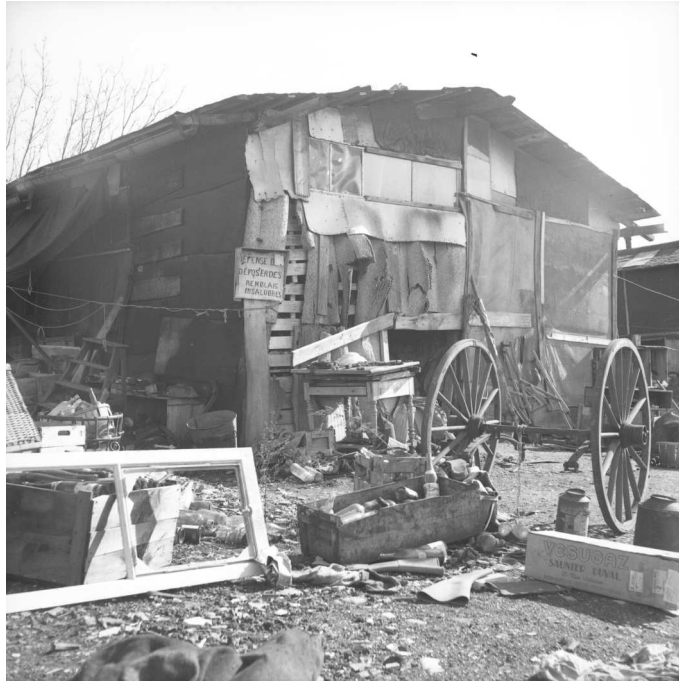
Dans le quartier des Buers, 1960