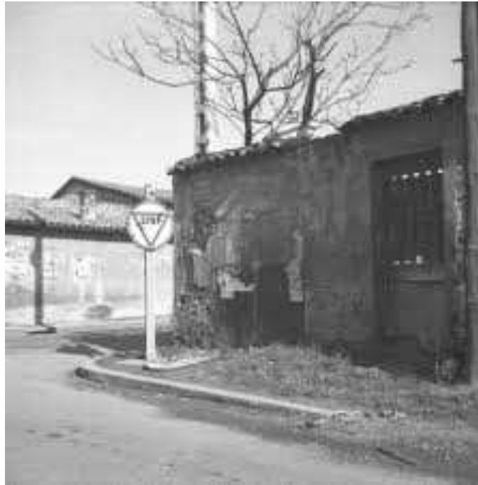
Le Chemin des Buers, 1960