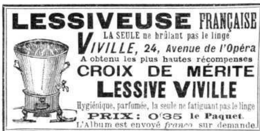
Publicité pour une lessiveuse, vers 1910