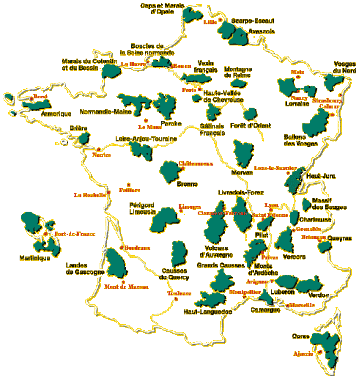
Les 40 parcs naturels régionaux en France (fin 2001)