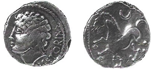
Fig. 2 : Statère MAN inv. num. 45.

Revers : cheval à gauche ; au dessus, un croissant ; dessous, une amphore.