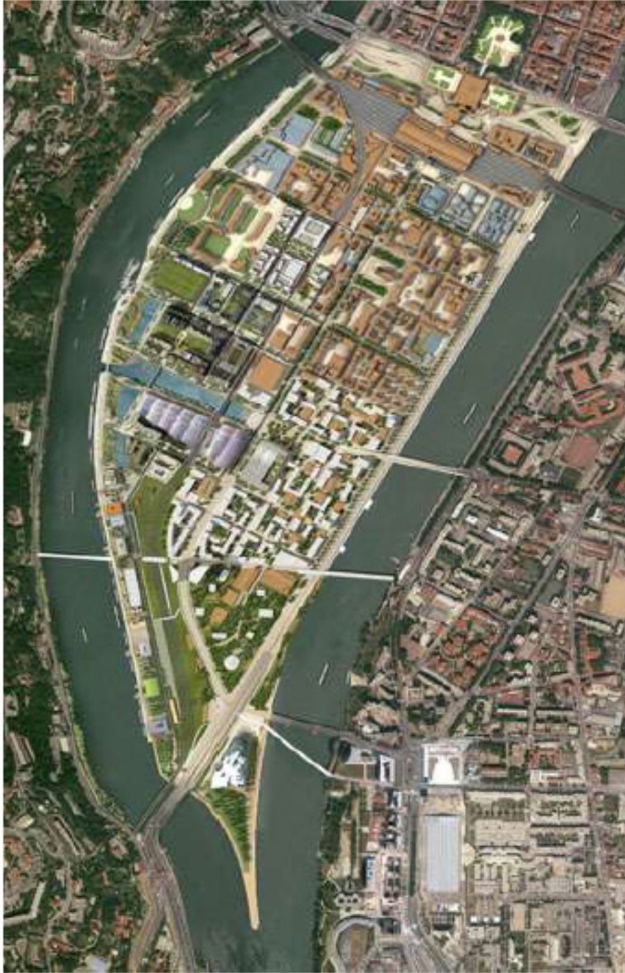
Figure 2. Plan masse du Projet de la Confluence / Master plan of the Project of the Confluence