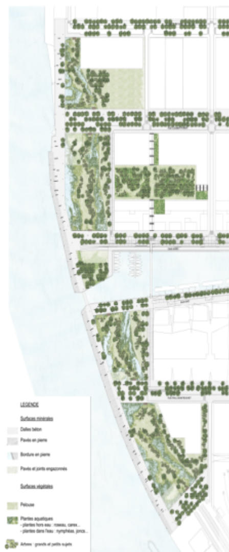
Figure 3. Plan masse du Projet des jardins aquatiques / Master plan of the Project of the aquatic gardens

Concepteurs : Michel Desvigne et François Grether