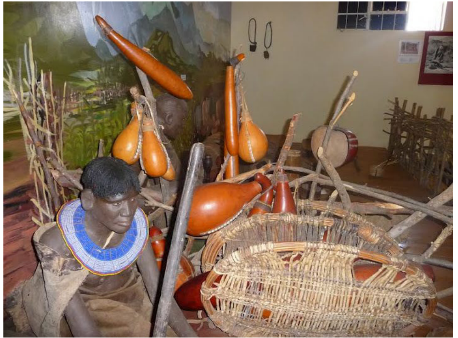
Photo1: La collection ethnographique Pokot du musée de Kapenguria, proche de celles du musée de Kitale et de Kabernet d'un point de vue de la muséographie et des artefacts présentés.

courte période (un conservateur est muté tous les trois ou quatre ans), son appartenance ethno-régionale ainsi que sa transparence sont autant de facteurs qui ont des incidences sur la continuité des priorités des politiques muséales internes à l'établissement qu'il dirige.