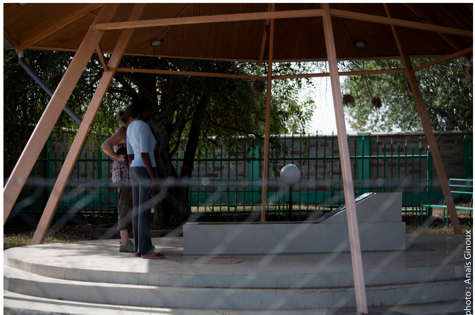
Photo 4 : Le mausolée d'Achieng Oneko, le dernier des Kapenguria Six décédé en 2007.

nationaux. De plus, la définition de la catégorie "héros" par la Taskforce on National Heroes and Heroines déployée depuis 2007 par le Ministry of State for National Heritage reste floue bien qu'elle se base sur une démarche jugée scientifique, chaque personnalité identifiée se voyant attribuer un pourcentage en terme