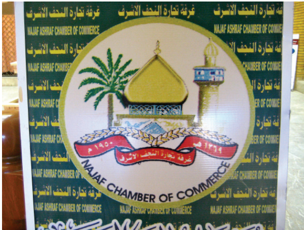
Le logo de la Chambre de commerce de Nadjaf

Nadjaf ne peut aujourd'hui prétendre à une place significative dans le concert économique mondial. Toutefois, sa capacité d'attractivité économique s'accroît avec l'existence de la Chambre de commerce et la création, en 2011, d'une Chambre d'arbitrage.