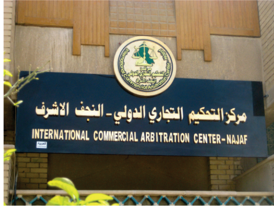
Le panneau à l'entrée du Centre d'Arbitrage international de Nadjaf © cliché Gérard-François Dumont - mars 2011.