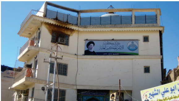
L'immeuble de la Bibliothèque, ouverte au public, de l'Ayatollah Al-Hakeem, situé juste en face de l'entrée sud du mausolée d'Ali à Nadjaf © cliché Gérard-François Dumont - mars 2011.

Nadjaf n'est certes pas connu dans le monde pour son université, d'autant que l'université a comme dénomination la ville limitrophe de Koufa. Mais la ville dispose de nombreuses bibliothèques ouvertes au public, comme la Bibliothèque de l'Ayatollah Al-Hakeem, et de nombreuses écoles religieuses qui attirent des étudiants parfois venus de loin. Les bibliothèques sont réparties dans des mosquées, dans des associations et des écoles ou dans les bâtiments privés. Elles contiennent non seulement des centaines de milliers de livres, mais aussi de nombreux livres rares et parfois des manuscrits historiques uniques, soit écrits par les mains de leurs auteurs, soit résultant de prise de notes pendant des audiences de hauts personnages, soit des copies des textes d'auteurs appréciés.