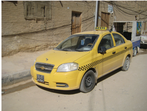
Le taxi est jaune comme à New York, mais nous sommes à Nadjaf (Irak) © cliché Gérard-François Dumont - mars 2011.

Certes, Nadjaf demeure une ville relativement pauvre au regard des standards occidentaux, et d'ailleurs fort poussiéreuse. Le besoin d'infrastructures en matière de réseaux d'électricité, d'assainissement, de transports, de services de nettoyage... est évident et considérable. Et la couleur jaune des taxis, comme à New York, ne peut masquer ce besoin. Les difficultés de la construction d'un nouvel Irak s'y font sentir par la nécessité de passer des check points visant à prévenir tout attentat terroriste.