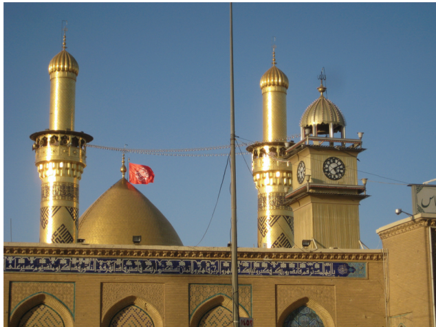
Le mausolée du fils d'Ali, Hussein, à Karbala © cliché Gérard-François Dumont - mars 2011.