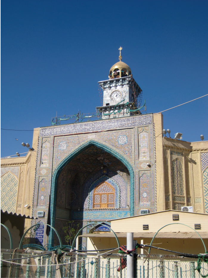
La porte Est du mausolée d'Ali à Nadjaf. Au premier plan, des barrières de protection, les pèlerins et visiteurs devant passer par un check point © cliché Gérard-François Dumont - mars 2011.

mausolée, voire d'embellissement, tout particulièrement grâce à des dons en nature ou financiers en provenance d'Iran. Par exemple, la réfection ou l'ajout de la grande majorité des mosaïques, décorations, ainsi que la façade dorée du tombeau ont ainsi été réalisées par des artisans iraniens. Des tapis indiquent de façon discrète « don de la ville d'Ispahan » ou « don de la ville de Chirâz ».