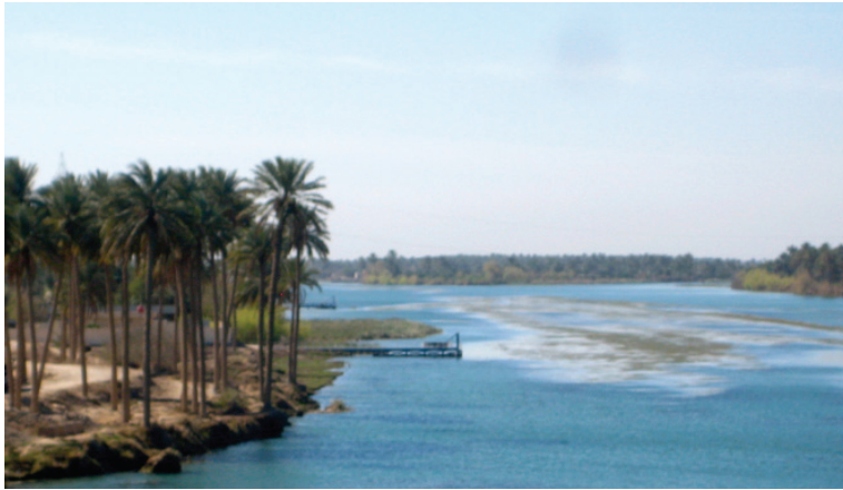
L'Euphrate est ses rives à une trentaine de kilomètres au nord-est de Nadjaf © cliché Gérard-François Dumont - mars 2011.

Nadjaf est également tête de réseau pour d'autres pèlerinages religieux ou pour découvrir le patrimoine irakien. D'une part, Nadjaf compte à proximité, à quelques kilomètres, la grande mosquée de Koufa, qui fait partie des étapes de tout pèlerinage. Selon les récits de la tradition chiïte, cette mosquée est le lieu où l'Imam Ali fut mortellement blessé par un coup d'épée en 661, alors qu'il était en train d'y prier. Puis, après avoir traversé Koufa, quelques kilomètres à l'est de la grande mosquée, se déploie l'Euphrate et ses rives enchantées.