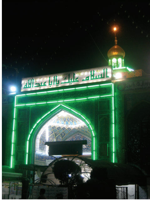
Le mausolée d'Abbas, demi-frère d'Hussein, à Karbala © cliché Gérard-François Dumont - mars 2011.