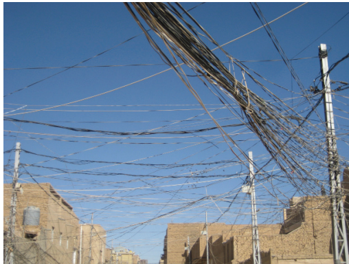
De multiples fils reliés à des habitations, un témoignage du besoin d'infrastructures à Nadjaf après des décennies de dictature et de conflits

© cliché Gérard-François Dumont - mars 2011.