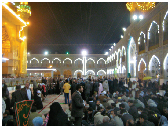
La cour intérieure du mausolée d'Ali à Nadjaf. Les pèlerins écoutent le récit des guides retraçant la vie et la mort d'Ali © cliché Gérard-François Dumont - mars 2011.