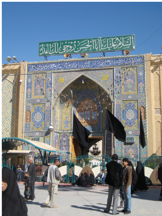
La porte Sud du mausolée d'Ali à Nadjaf © cliché Gérard-François Dumont - mars 2011.