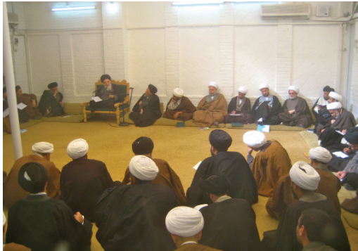
Une école religieuse (hawza), celle du grand Ayatollah Al-Hakeem

La notoriété des écoles religieuses de Nadjaf se diffuse dans tout le monde chiite, avec ses grands maîtres, dont l'une des figures principales du chiisme citées ci-dessus, l'Ayatollah Sistani, d'origine iranienne. Aussi, en dépit de l'existence de la ville sainte de Qom en Iran, un nombre croissant d'étudiants en théologie iraniens viennent étudier à Nadjaf.