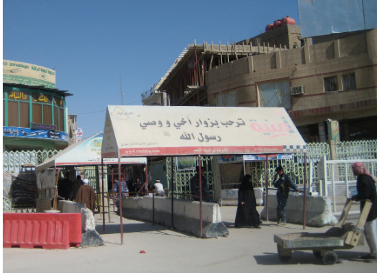
Un check point à l'entrée du centre-ville de Nadjaf © cliché Gérard-François Dumont - mars 2011.

En outre, Nadjaf peut aussi être une tête de réseau touristique pour un lieu bien antérieur à la naissance du chiisme, mais qui se trouve être un héritage essentiel des civilisations, Babylone, à 61 km au nord de Nadjaf. Le site de Babylone pourrait d'ailleurs aisément accroître son attractivité en déployant des travaux archéologiques supplémentaires.