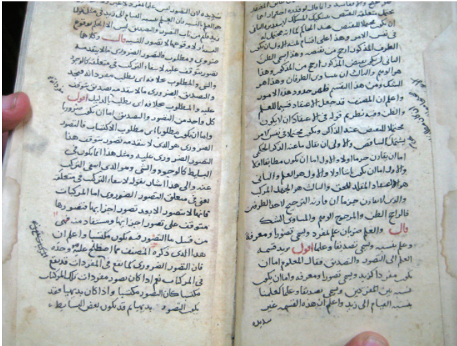
Un des manuscrits rares possédés par la Bibliothèque de l' Ayatollah Al-Hakeem © cliché Gérard-François Dumont - mars 2011.

Après le déclin subi sous le régime de Saddam, depuis 2003, Nadjaf, lieu de fondation de la première école religieuse chiite en 1056, est redevenue la principale hawza du monde chiite, terme qui désigne l'ensemble des séminaires de la ville, mais qui peut s'appliquer aussi à un seul séminaire. Les écoles religieuses de Nadjaf sont dirigées par des enseignants ayant le titre d'ayatollah ou des grands ayatollahs (ou marja). Le marja développe, notamment à partir de commentaires des textes coraniques, et en donnant des avis sur l'application des sources islamiques à la période actuelle, une doctrine qui fait référence pour ses disciples. Lorsque deux marjas professe une opinion différente, le disciple suit l'opinion de son propre marja. Le rôle politique du marja est un sujet de débat juridique intense. D'un côté, se trouvent les tenants du Velayat-e faqih, ce qui signifie les conservateurs de la jurisprudence ou encore gouvernement du docte, comme Rouhollah Mousavi Khomeini (1902-1989), qui souhaitent que les marjas gouvernent. En revanche, des partisans du grand Ayatollah Ali Sistani considèrent que le marja a autorité suprême pour fixer les grands principes politiques et sociaux, mais que c'est au gouvernement séculaire de gouverner. Quant aux quiétistes, ils ne souhaitent aucune implication des religieux dans la politique séculaire. Par exemple, au fil des interventions d'Ali Sistani depuis