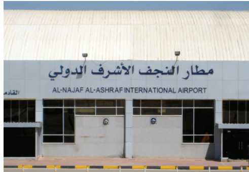
L'aéroport international de Nadjaf © cliché Gérard-François Dumont - mars 2011.