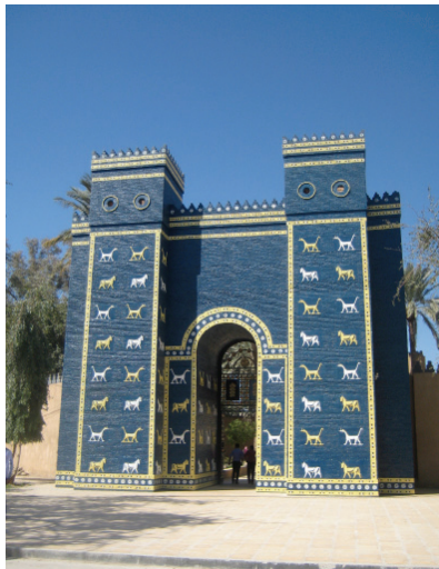
La porte d'Ishtar à Babylone, construite en 580 av J.-C. © cliché Gérard-François Dumont - mars 2011.

En outre, Nadjaf peut aussi être une tête de réseau touristique pour un lieu bien antérieur à la naissance du chiisme, mais qui se trouve être un héritage essentiel des civilisations, Babylone, à 61 km au nord de Nadjaf. Le site de Babylone pourrait d'ailleurs aisément accroître son attractivité en déployant des travaux archéologiques supplémentaires.