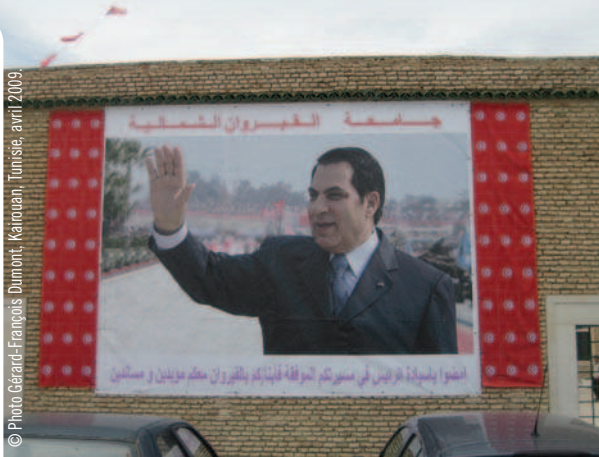
Karouan, Tunisie, avril 2009.

De l'évolution démographique de la Tunisie résulte une pyramide des âges qui montre que le début des années 2010 est marqué par les classes d'âge 20-24 ans et 25-29 ans 3 , qui forment les générations les plus nombreuses. Ces dernières se retrouvent avec un poids démographique inédit, absolu et relatif. Mais le régime ne les a pas vues venir. Il a bénéficié dans les années 2000 d'une diminution du taux de dépendance en raison des effectifs limités de personnes âgées et d'une réduction du nombre de jeunes à scolariser dans les écoles et les collèges. C'était le moment où les réformes étaient particulièrement indispensables pour répondre aux besoins et aux attentes des générations les plus nombreuses qui allaient arriver à l'âge actif.