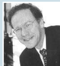
© Gérard-François Dumont - Chiffres Census Bureau.