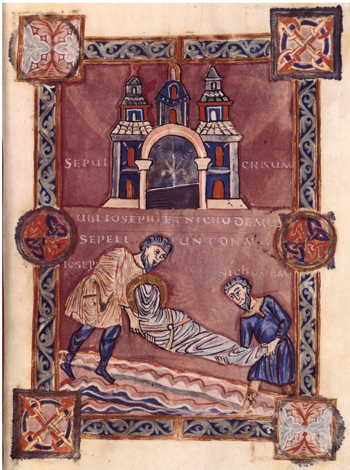
Fig. 2. – Ms. Paris, BnF, Arsenal 592, f. 69.