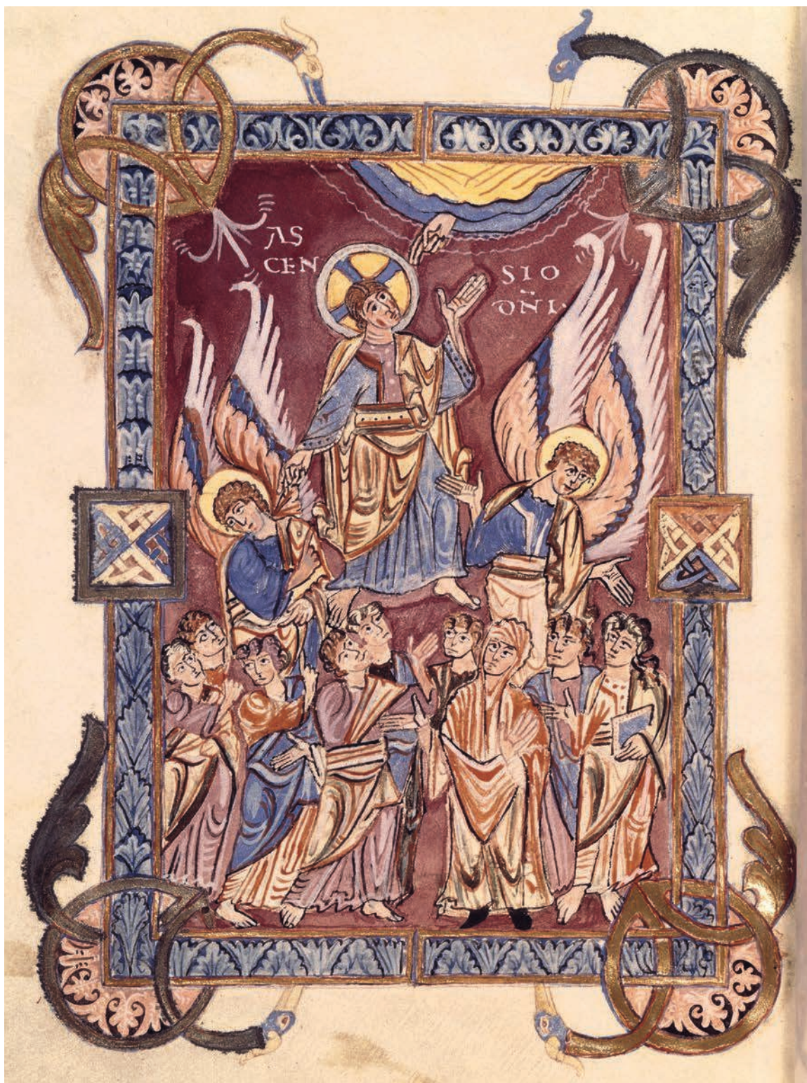
Fig. 5. – Ms. Paris, BnF, Arsenal 592, f. 157v.