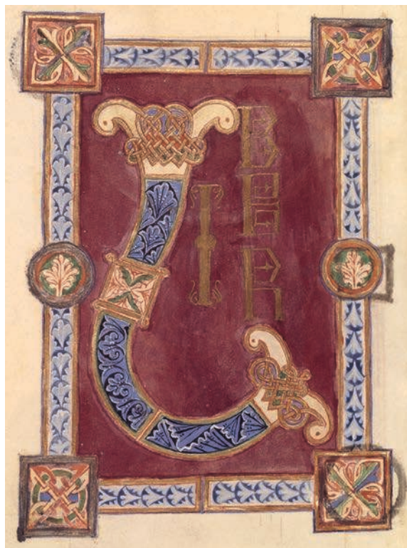
Fig. 1. – Ms. Paris, BnF, Arsenal 592, f. 19v.

Joseph et Nicodème semblent descendre la pente du mont Calvaire en emportant le corps du Christ. Pour accentuer cette impression, les jambes de Nicodème sont partiellement dissimulées par la bordure de l'image. L'action se poursuit hors champ. Le peintre a représenté le sol sous forme de bandes ondulantes