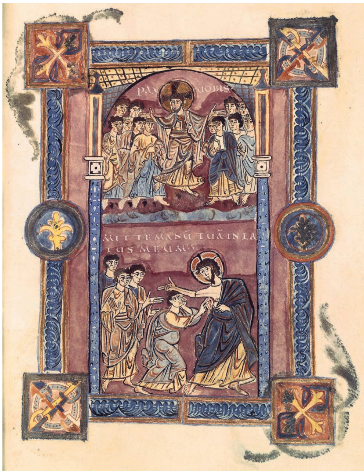
Fig. 4. – Ms. Paris, BnF, Arsenal 592, f. 105 (cliché BnF).