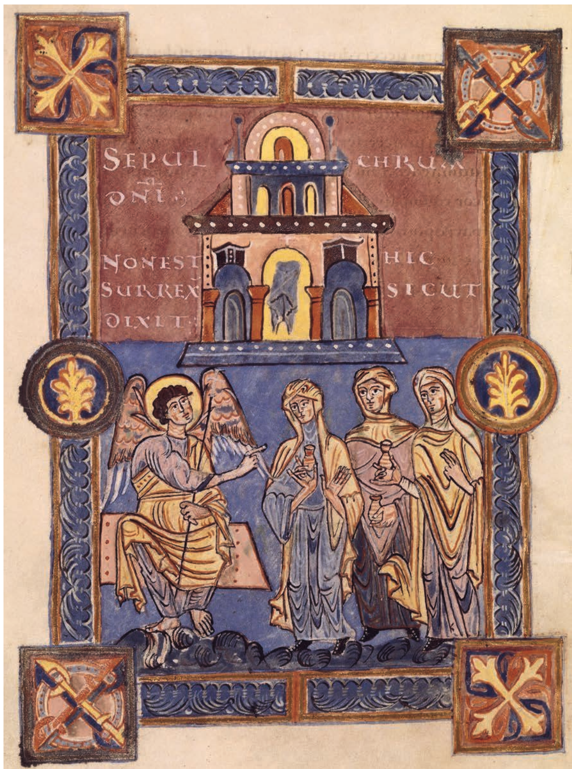
Fig. 3. – Ms. Paris, BnF, Arsenal 592, f. 104v.