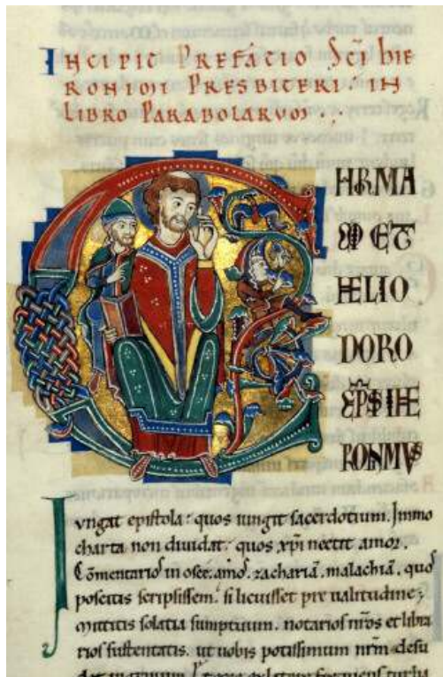
Fig. 4 – Bible de Saint-Bénigne de Dijon, op. cit. , fol. 288v°, initiale C.