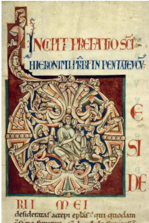
Fig. 1 – Bible de Saint-Bénigne de Dijon , DIJON, Bibliothèque municipale , ms. 2, fol. 6r°, initiale D, 2 e quart du XII e siècle ?