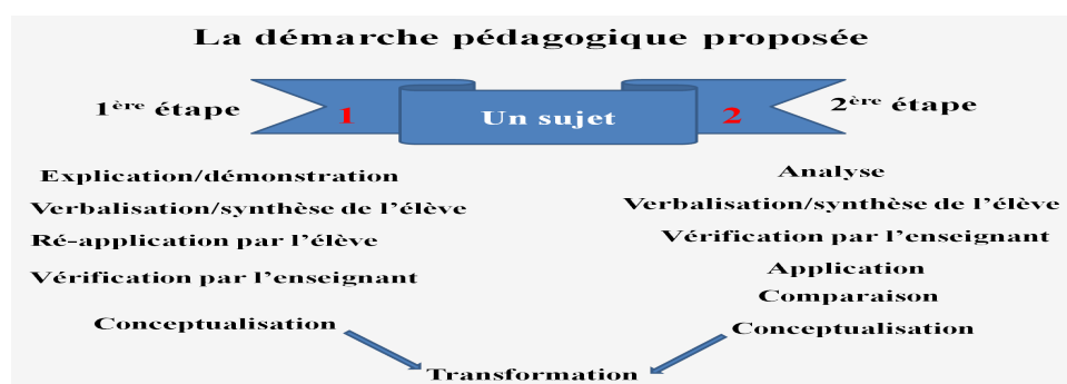
Figure 2 : la démarche pédagogique proposée

Au vu des résultats recueillis et des démarches pédagogiques existantes, nous avons proposé une démarche adaptée au contexte d'apprentissage, en tenant des contraintes de fonctionnement de l'établissement, pour permettre une meilleure acquisition des compétences et formation des élèves en fin de formation initiale.