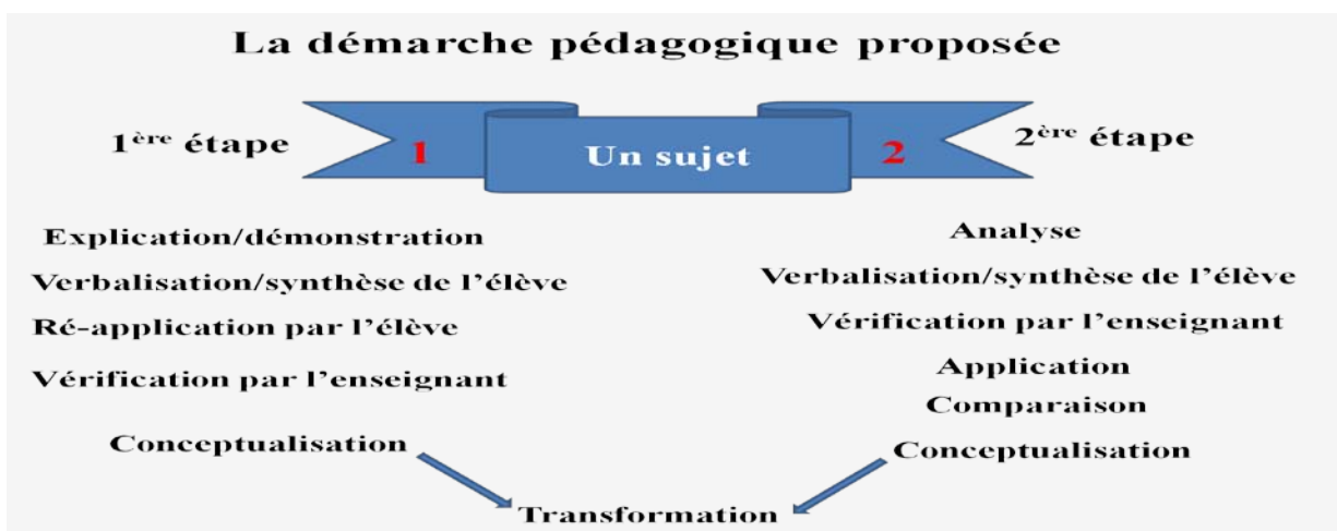
Figure3: démarche pédagogique proposée

Au vue des résultats recueillis et des démarches pédagogiques existantes, nous avons proposé une démarche adaptée au contexte d'apprentissage, en tenant compte des contraintes de fonctionnement de l'établissement, pour permettre une meilleure acquisition des compétences et formation des élèves en fin de formation initiale.