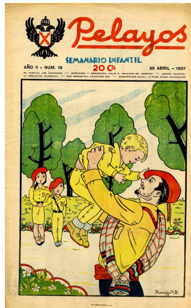
Pelayos. Semnario infantil, n° 18, Saint-Sébastien, 25-IV-1937 (ill. 2)

« Les rouges lui coupèrent les extrémités ; les bras, les oreilles, le nez, etc., et ainsi, dans des souffrances indicibles, notre héroïque "requeté" termina sa vie TERRESTRE [sic] et se dirigea vers le ciel avec la belle palme du martyr. » 39