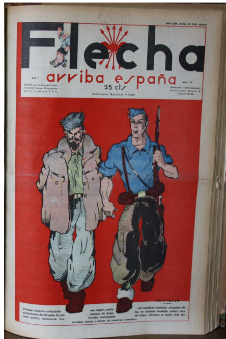
Flecha. Arriba España, n° 27, Saint-Sébastien, 25-VII-1937 (ill. 4)