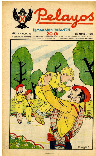
Pelayos. Semanario infantil, n° 18, Saint-Sébastien, 25-IV-1937 (ill. 2)

« Les rouges lui coupèrent les extrémités ; les bras, les oreilles, le nez, etc., et ainsi, dans des souffrances indicibles, notre héroïque "requeté" termina sa vie TERRESTRE [sic] et se dirigea vers le ciel avec la belle palme du martyr. » 39