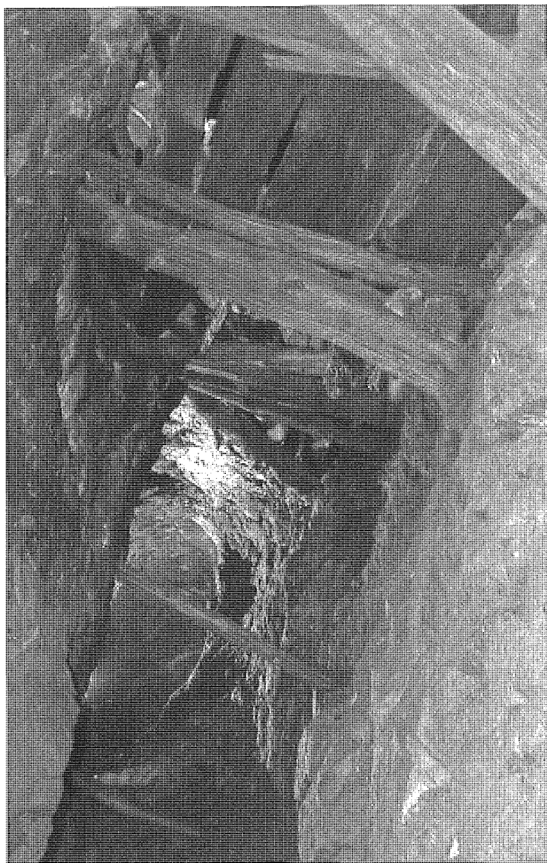
Fig. 6 - Chantier de la Grande Fosse de Fangeas (X e -XI e s.), à Freissinières (Hautes-Alpes, France), ouvert par le feu et boisé (cf. B. Ancel, 2008).