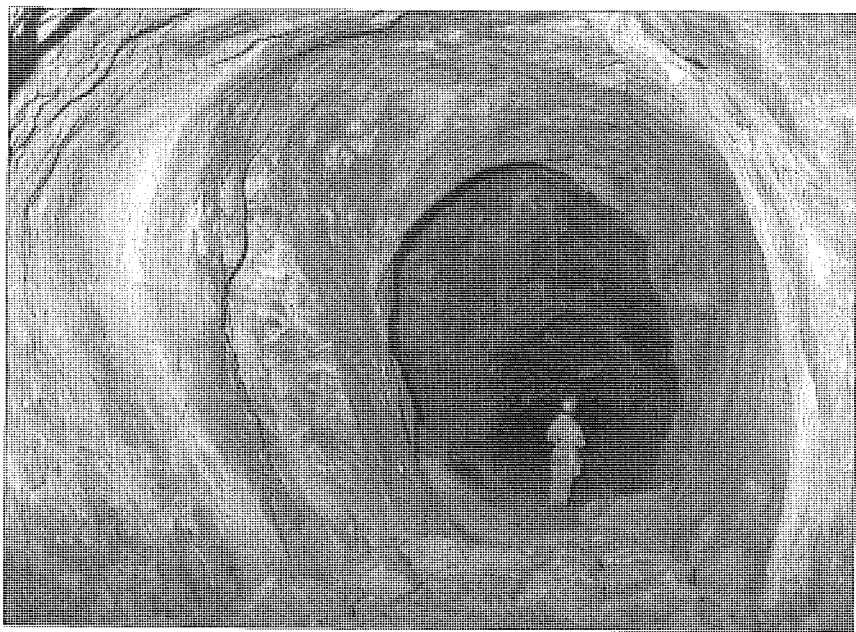
Fig. 2 - Chantier sur stockwerk dans la mine d'or de Carnic à Rosia Montana (époque romaine) (Roumanie) (cl. B. Ancel, 2000).

Les données archéologiques, textuelles et iconographiques donnent une image relativement précise, mais incomplète, du mode opératoire associé à la technique d'abattage par le feu. La documentation historique pointe l'organisation du travail, sa codification, les difficultés propres à l'usage souterrain du feu. À partir de la Renaissance, elle met en scène le bûcher et le mineur. Malgré le décalage d'échelles chronologiques et géographiques, les textes convergent tous vers une constatation : l'abattage par le feu en mine relève d'un véritable savoir-faire. Il est fondé sur la maîtrise de plusieurs facteurs : variation de dureté de la roche, gîtologie, morphologie du front de taille, circulation de l'air, calibre et hygrométrie du bois, forme des bûchers. Dès le XVI e siècle, les textes et les fronts de taille témoignent d'une volonté de réduire son usage grâce au perfectionnement de la taille manuelle combinée au feu puis aux explosifs. Au Moyen Âge, les mineurs ont entièrement percé au moyen du feu des kilomètres de galeries, des puits verticaux, obliques, et ont ouvert des chambres souterraines parfois spectaculaires. Or, la documentation de cette période ne dit rien de leur