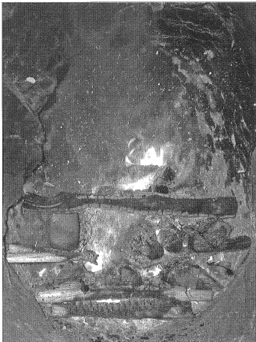
Fig. 5 - Bûcher expérimental avec projection de plaquettes (étonnement).