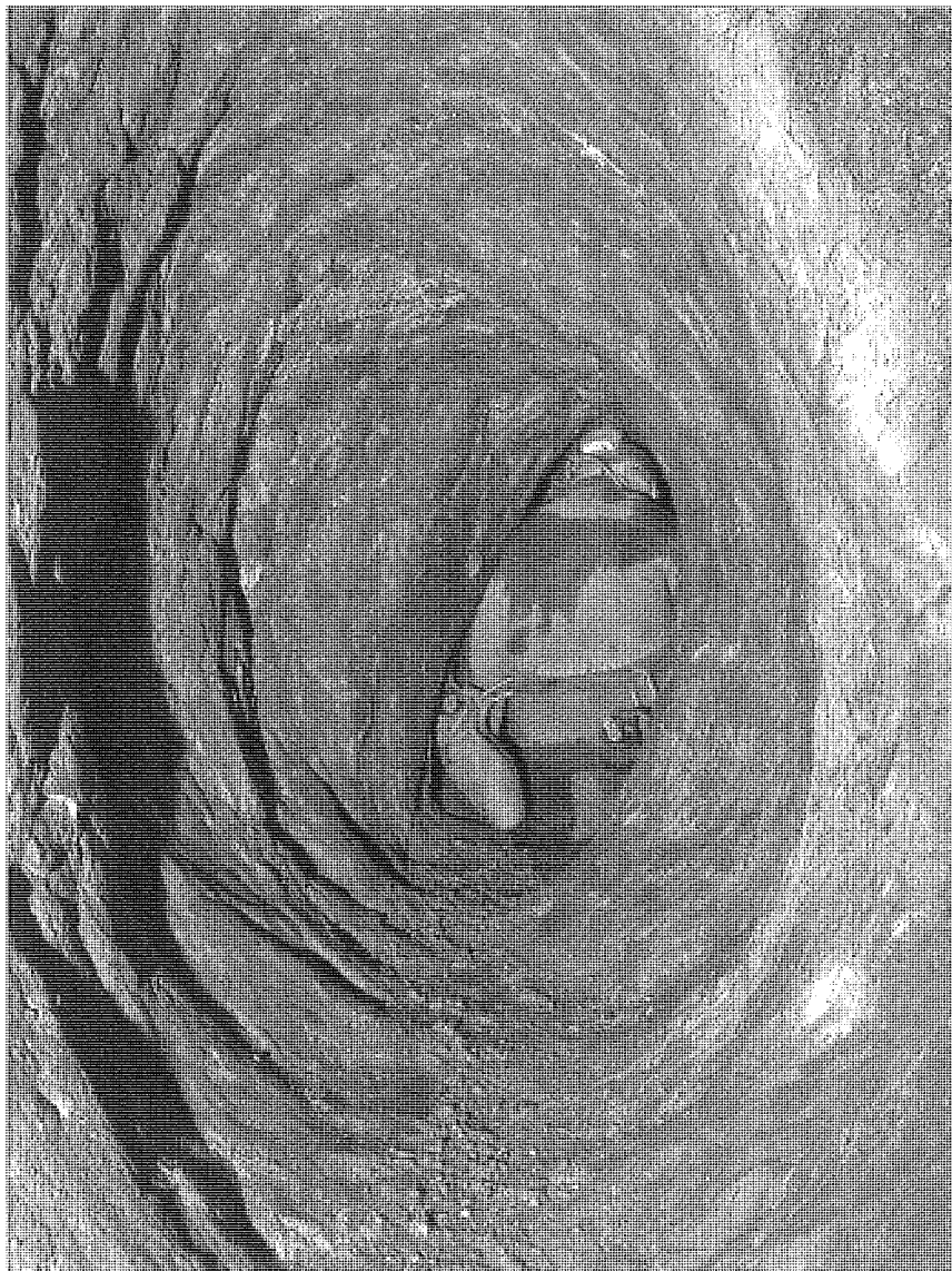
Fig. 3 - Galerie en travers-bancs dans la mine de plomb argentifère du Castelminier à Aulus-les-Bains (Moyen Âge) (Ariège, France).