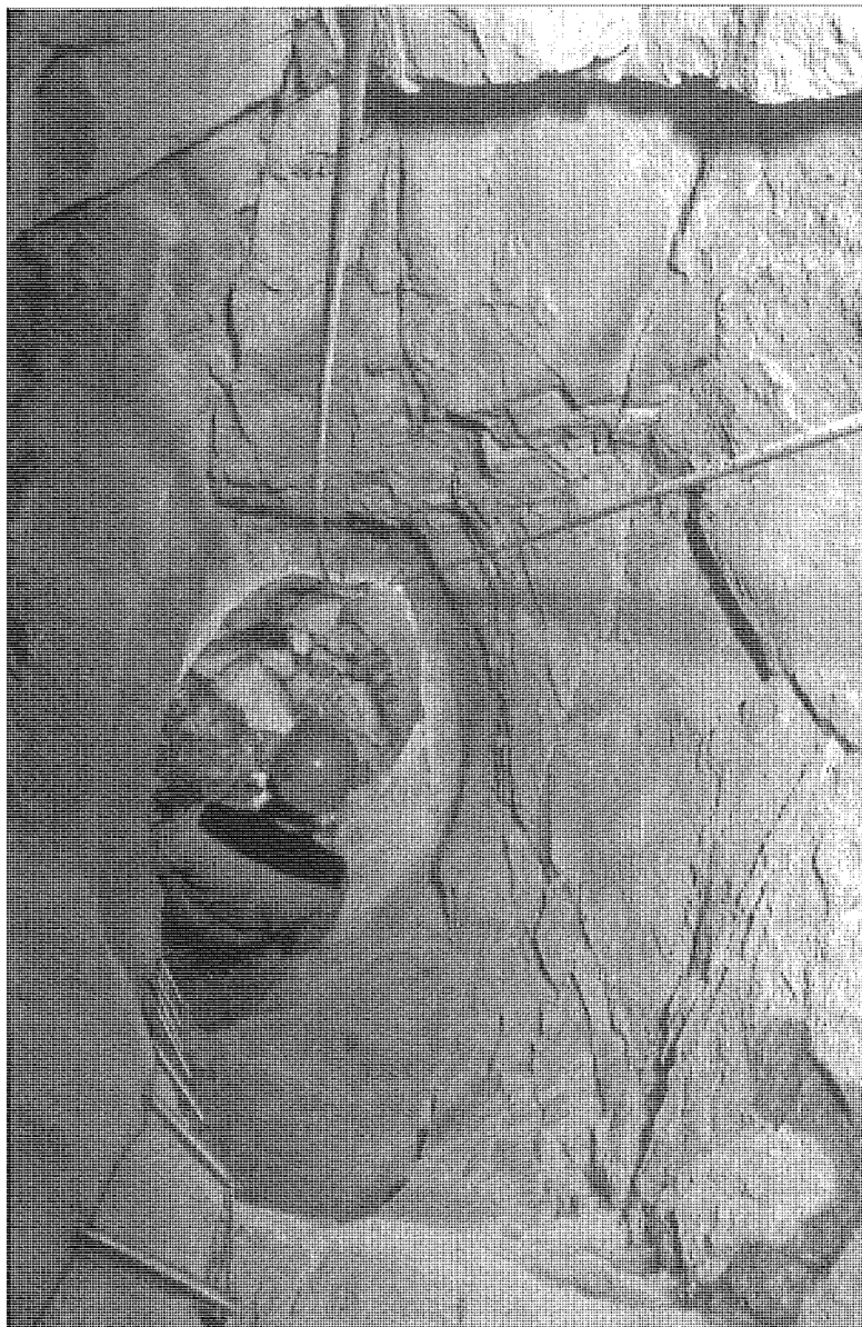
Fig. 4 - Puits de recherche aveugle en cours de fouille dans la mine de plomb argentifère de la Pinée (XII e s.), à L'Argentière-La-Bessée (Hautes-Alpes, France).