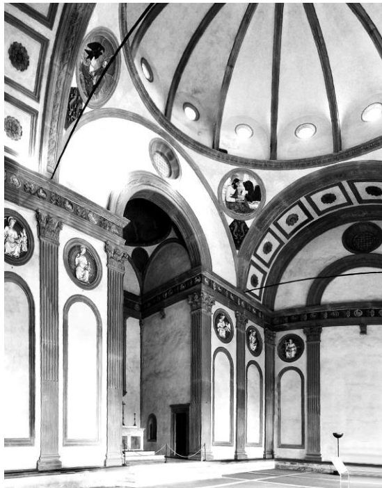
Capella Pazzi, Brunelleschi, Florence

Ou bien au contraire, le bon architecte doit-il ne rien laisser au hasard ? Pour les bâtisseurs de la Renaissance, il ne s'agissait certainement pas de copier les Anciens, mais de se servir des ordres grecs dorique, ionique et corinthien ainsi que des éléments qu'ils ordonnent (pilastres, frontons, métopes et triglyphes, caryatides puis chez les Romains, voûtes d'arêtes, fenêtres thermales, etc.) pour constituer un nouveau langage aussi inventif que peut l'être la poésie ou le théâtre.