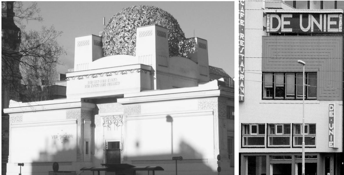
J.-M. Olbrich, immeuble de la Sécession, Vienne 1898, et J. J. P. Oud, café De Unie, Rotterdam 1924.

simples sous la lumière » avec une confiance sans mélange dans la technique et l'industrialisation.