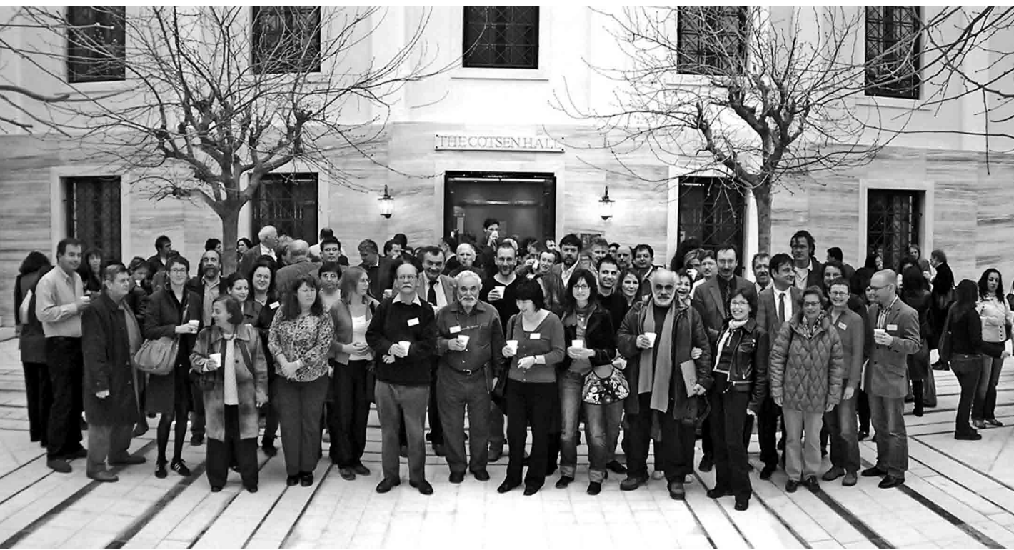
Une partie des congressistes devant le Cotsen Hall