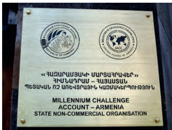
Photo 13. Le siège du Millenium Challenge à Erevan © Photo Gérard-François Dumont.

Certes, les relations entre les diasporas arméniennes, l'Arménie et le Haut-Karabagh, sont parfois mouvementées. Mais elles témoignent d'une intense collaboration. Comme l'écrit un auteur, la diaspora arménienne est « un « atout stratégique » pour Erevan (et Stepanakert), comparable aux richesses de l'Azerbaïdjan en hydrocarbures » 19 .