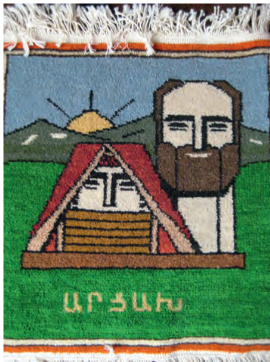
Photo 2. La sculpture symbolisant le Haut-Karabagh « Nous sommes nos montagnes » reproduite sur un tapis © Photo Gérard-François Dumont.

D'une superficie de 4 400 km 2 , soit l'équivalent d'un département français, le Haut-Karabagh se situe dans le Sud-Est du Caucase mineur. Son paysage montagneux, avec une altitude moyenne de 1 100 mètres au-dessus du niveau de la mer, contient ses plus hauts sommets au nord, soit le Gomchassar (3 724 m), le Mrav (3 343 m), le pic des Quarante Filles (Karrassoun Aghtchikner, 2 828 m) et le pic de Dizapaït (2 480 m). Les montagnes, qui représentent plus de 36% du territoire, sont en majeure partie couvertes de forêts. La roche nue apparaît uniquement dans les régions de hauts plateaux montagneux qui, comme tous les hauts plateaux d'Arménie, ont une activité sismique.