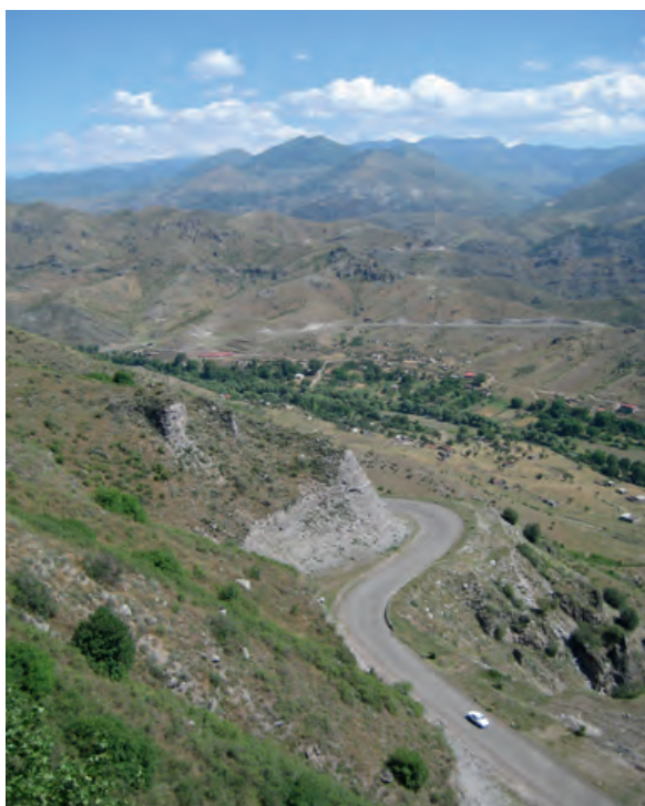
Photo 8. Le corridor de Latchine (entre le Haut-Karabagh et l'Arménie) : la route venant d'Arménie, précisément de la ville de Goris, descend en lacet dans la vallée où se trouve le poste frontière du Haut-Karabagh. Puis elle remonte en lacet vers le Haut-Karabagh, vers Berdzor (appelée aussi Latchin), Chouchi puis Stepanakert © Photo Gérard-François Dumont.

Au plan ferroviaire, aucune voie ferrée venant d'Arménie ne dessert le Haut-Karabagh et cela ne se produira pas avant longtemps car une telle réalisation supposerait des investissements considérables dans ce milieu montagneux.