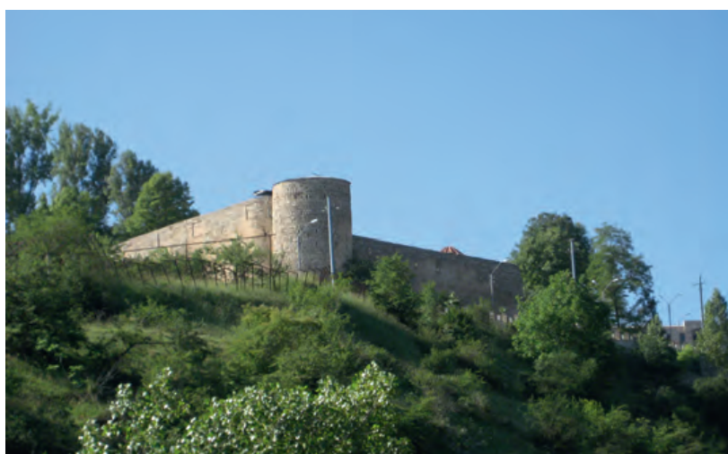
Photo 4. La citadelle de Chouchi (Haut-Karabagh) © Photo Gérard-François Dumont.