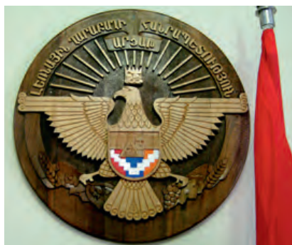
Photo 15. Les armoiries du Haut-Karabakh © Photo Gérard-François Dumont.

Le Haut-Karabagh a également choisi des armoiries d'État représentant un aigle aux ailes étendues vers les côtés, portant sur sa tête, illuminée de rayons de soleil, la couronne de la dynastie royale des Artaxides 20 . En leur centre, sur le fond du drapeau national et d'un mont, les armoiries comportent l'image de la statue de « Nous sommes nos montagnes ». En bas, dans ses griffes, l'aigle tient une grappe de raisin, des mûres et des pousses de blé, les cultures les plus représentatives du Haut-Karabakh. En haut des armoiries, dans un demi-cercle, l'inscription suivante est écrite en arménien : « La République du Haut-Karabakh-Artsakh ». Le Haut-Karabakh a également choisi un hymne adopté par la décision de son Assemblée nationale du 17 novembre 1992.