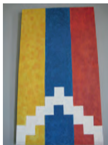
Photo 14. Le drapeau du Haut-Karabagh © Photo Gérard-François Dumont.

Le Haut-Karabagh a également choisi des armoiries d'État représentant un aigle aux ailes étendues vers les côtés, portant sur sa tête, illuminée de rayons de soleil, la couronne de la dynastie royale des Artaxides 20 . En leur centre, sur le fond du drapeau national et d'un mont, les armoiries comportent l'image de la statue de « Nous sommes nos montagnes ». En bas, dans ses griffes, l'aigle tient une grappe de raisin, des mûres et des pousses de blé, les cultures les plus représentatives du Haut-Karabakh. En haut des armoiries, dans un demi-cercle, l'inscription suivante est écrite en arménien : « La République du Haut-Karabakh-Artsakh ». Le Haut-Karabakh a également choisi un hymne adopté par la décision de son Assemblée nationale du 17 novembre 1992.