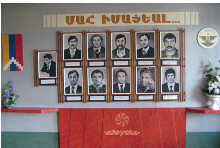
Photo 11. Un hommage à des morts arméniens de la guerre à l'entrée de l'immeuble de la Présidence de la république du Haut-Karabagh © Photo Gérard-François Dumont.

Mais le très faible poids démographique relatif du Haut-Karabagh est surtout compensé par l'existence de l'importante diaspora arménienne, qui serait d'environ 6 millions de personnes, dont plus de 2 millions en Russie, 1,4 million aux États-Unis et 600 000 en France.