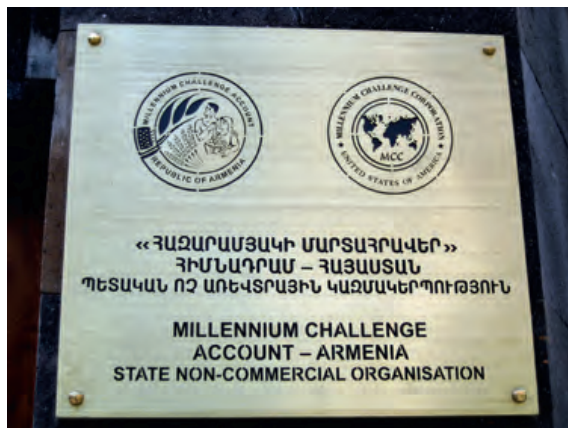
Photo 13. Le siège du Millenium Challenge à Erevan © Photo Gérard-François Dumont.

Certes, les relations entre les diasporas arméniennes, l'Arménie et le Haut-Karabagh, sont parfois mouvementées. Mais elles témoignent d'une intense collaboration. Comme l'écrit un auteur, la diaspora arménienne est « un « atout stratégique » pour Erevan (et Stepanakert), comparable aux richesses de l'Azerbaïdjan en hydrocarbures » 19 .