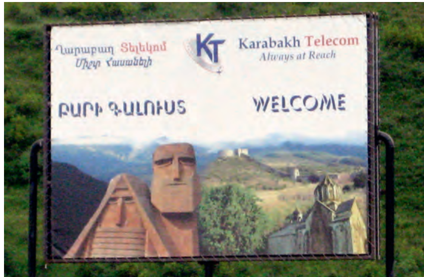
Photo 1. La sculpture symbolisant le Haut-Karabagh « Nous sommes nos montagnes » utilisée par une publicité © Photo Gérard-François Dumont.

un royaume d'Arménie. Aujourd'hui, la dénomination la plus courante, Haut-Karabagh, se réfère évidemment au caractère montagneux de cette région. Ce caractère est symbolisé, depuis la fin des années 1960, par une sculpture intitulée « Nous sommes nos montagnes » 1 , très souvent reproduite au Haut-Karabagh car censée illustrer « l'indomptable esprit local ». Réalisée en 1967, cette sculpture, œuvre de l'arménien Sarkis Baghdassarian, est située sur une butte, à proximité de la route, à 1 km au nord-est de Stepanakert, la capitale du Haut-Karabagh. Elle représente les bustes de deux paysans aux visages stylisés, un homme barbu et une femme, Papik et Dadik (« grand-père » et « grand-mère »), aux coiffes traditionnelles pouvant rappeler les deux sommets de l'Ararat 2 . La bouche de la femme est masquée par un foulard, selon la tradition locale, et les deux bustes semblent appuyés l'un contre l'épaule de l'autre. La sculpture est posée directement sur le sol, donc non sur un piédestal. Lorsque les représentants soviétiques de Bakou sont venus à Stepanakert pour l'inauguration, en 1968, ils demandèrent : « Ces personnages n'ont-ils pas de jambes ? » L'artiste a répondu : « Mais si, et elles sont profondément enracinées dans leur terre. »