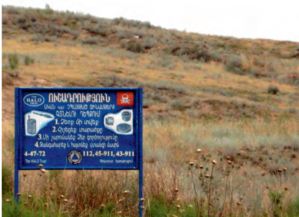
Photo 3. Une ligne de cessez-le-feu toujours dangereuse entre l'Azerbaïdjan et le Haut-Karabakh

1915-1920 : génocide des Arméniens perpétré par le gouvernement jeune-turc : 1 500 000 victimes.