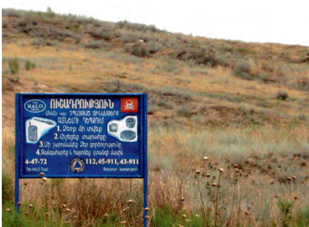
Photo 3. Une ligne de cessez-le-feu toujours dangereuse entre l'Azerbaïdjan et le Haut-Karabakh

1915-1920 : génocide des Arméniens perpétré par le gouvernement jeune-turc : 1 500 000 victimes.