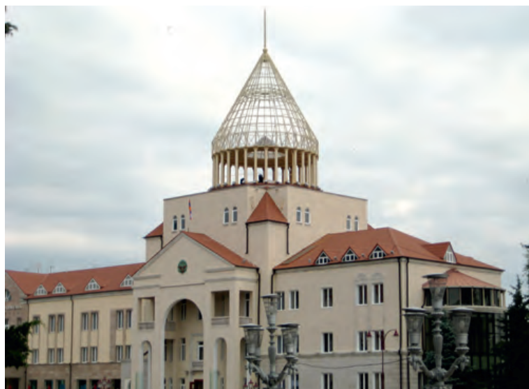
Photo 16. Le Parlement du Haut-Karabagh à Stepanakert © Photo Gérard-François Dumont.

Par ailleurs, le Haut-Karabagh plaide en argumentant à partir de la Convention de Montevideo de 1933 sur les droits et les devoirs des États établie lors de la septième Conférence internationale des États américains. Cette convention, dans son article 1 er , précise qu'un État est composé « d'un territoire défini, d'une population permanente, d'un gouvernement » et qu'il doit « avoir la capacité d'établir des relations avec d'autres États ». Or le Haut-Karabagh considère qu'il remplit les conditions de cette Convention et constitue donc un État indépendant au sens du droit international, avec les quatre arguments suivants 22 .