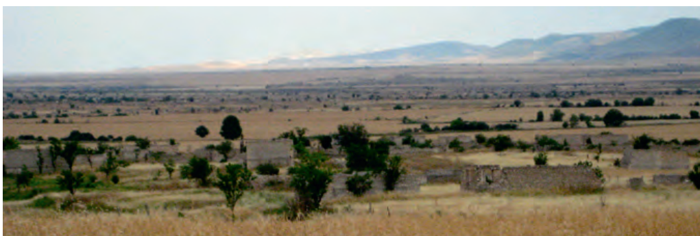
Photo 10. Un village azéri du Haut-Karabagh dont les habitants ont subi l'exode du fait de la guerre.

La dimension démographique du conflit se lit aussi dans les poids démographiques fortement inégaux des parties en présence : 3,3 millions d'habitants en