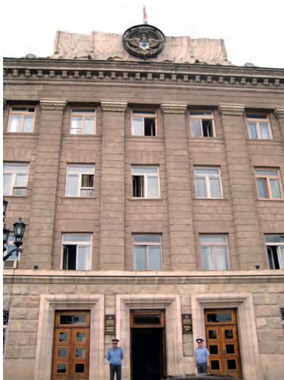
Photo 17. La Présidence de la république du Haut-Karabagh à Stepanakert

En outre, la république du Haut-Karabagh considère que son espoir d'une reconnaissance internationale s'est accru depuis celle de l'indépendance du Kosovo par de nombreux pays et parce que la Cour internationale de justice de La Haye a jugé le 22 juillet 2010 que « l'adoption de la déclaration d'indépendance du 17 février 2008 du Kosovo n'a violé ni le droit international général, ni la résolution 1244 du conseil de sécurité de l'Onu, ni le cadre constitutionnel ». Le Président de la république du Haut-Karabagh, Bako Sahakian, a déclaré que « cette décision est