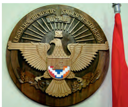
Photo 15. Les armoiries du Haut-Karabakh © Photo Gérard-François Dumont.

Le Haut-Karabagh a également choisi des armoiries d'État représentant un aigle aux ailes étendues vers les côtés, portant sur sa tête, illuminée de rayons de soleil, la couronne de la dynastie royale des Artaxides 20 . En leur centre, sur le fond du drapeau national et d'un mont, les armoiries comportent l'image de la statue de « Nous sommes nos montagnes ». En bas, dans ses griffes, l'aigle tient une grappe de raisin, des mûres et des pousses de blé, les cultures les plus représentatives du Haut-Karabakh. En haut des armoiries, dans un demi-cercle, l'inscription suivante est écrite en arménien : « La République du Haut-Karabakh-Artsakh ». Le Haut-Karabakh a également choisi un hymne adopté par la décision de son Assemblée nationale du 17 novembre 1992.