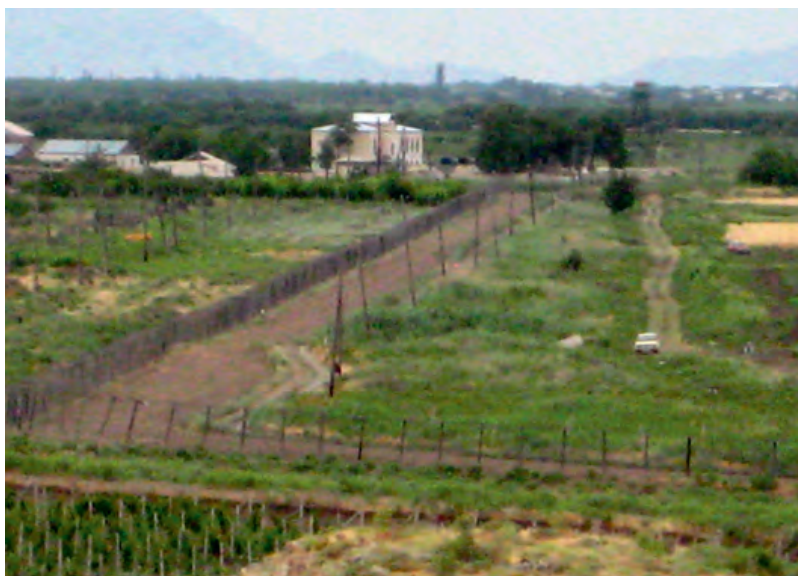
Photo 9. La frontière arméno-turque au sud d'Erevan. Une frontière totalement fermée en raison du blocus terrestre imposé par le Turquie à l'Arménie depuis 1992 © Photo Gérard-François Dumont.

L'enclavement de l'Arménie ne se trouve surtout réduite que par deux éléments. Le premier tient à ses aéroports, dont le plus important est celui d'Erevan. Le second est sa courte, mais largement ouverte, frontière à son extrémité sud-est avec l'Iran, qui lui offre sa grande voie terrestre de communication avec l'extérieur. En effet, de ses quatre pays limitrophes, l'Arménie n'entretient de bonnes relations qu'avec l'Iran, comme en témoigne la fréquence des visites bilatérales au plus haut niveau, ainsi que par la signature d'un certain nombre de conventions. L'Arménie enclavée étant le seul pays à épauler fortement le Haut-Karabagh, ce dernier ne peut bénéficier de liens maritimes puisque, comme le note l'ancien président arménien Léon Ter-Pétrossian : « Dans cette île qu'est la Transcaucasie, à la différence de la Géorgie et de l'Azerbaïdjan, l'Arménie ne dispose d'aucun accès maritime » 10 .