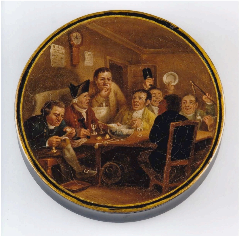
Abb. 9: Schnupftabakdose »Clubgesellschaft«, wohl Raven, Birmingham, erstes Drittel des 19. Jahrhunderts, 2,3 x 10,6 cm, Privatsammlung Braunschweig. Das Motiv entstammt der Malerei nach der Zeichnung »The Clubbist« von David Wilkie (1785–1841).

zeigte Barmherzigkeit und bat, dass die Untersuchung gegen Levi Flaetscher eingestellt und dieser wieder auf freien Fuß gesetzt werde 225 .