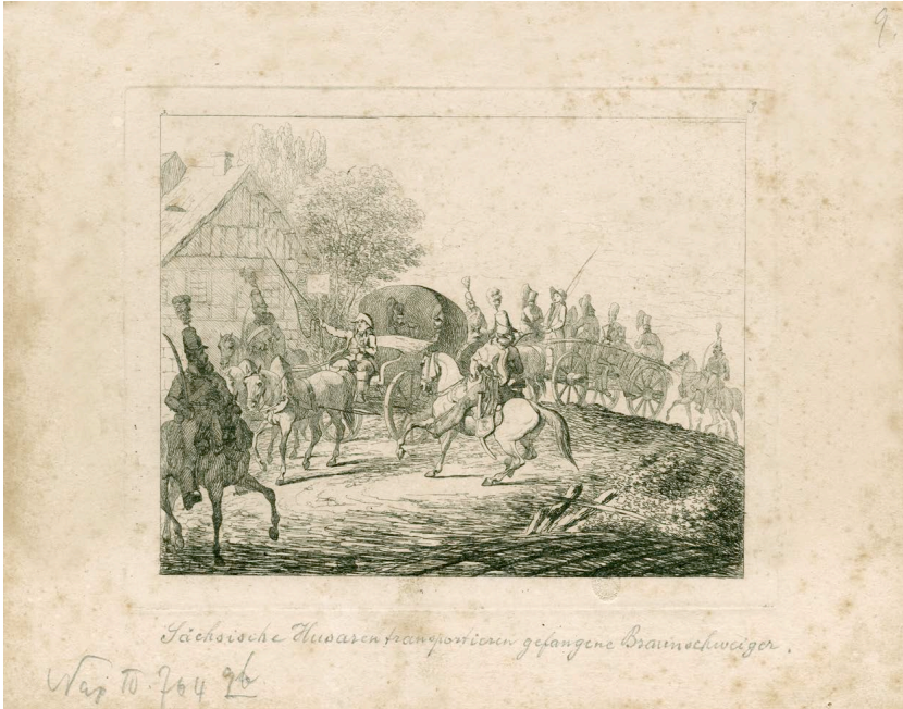
Abb. 7: Alexander Sauerweid, Gefangene Officiere und Gemeine des Braunschweiger Corps werden durch sächsische Husaren transportirt , aus: Kriegs-Scenen bei Dresden , Bl. 3, 1810, Radierung, 14,8 x 18,5 cm, Nap. IV.764.9 b, Rp.128/1913, Stadtgeschichtliches Museum Leipzig, VS 1453.

Die Familie von Gehren kam mit dem Schrecken davon 101 . Das Beispiel zeigt, wie unaufhaltbar die Gerüchte Nachrichten verbreiteten und wie sie die Zeitgenossen in Bewegung setzten.