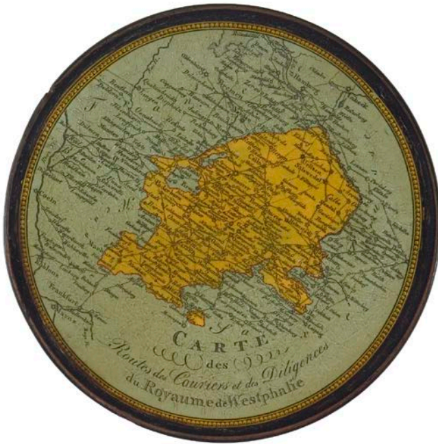
Abb. 1: Schnupftabakdose mit einer »Carte des Routes, des Couriers et des Diligences du Royaume de Westphalie« auf dem Deckel, Manufaktur Stobwasser, Braunschweig, nach 1808, 1,8 x 10 cm, Städtisches Museum Braunschweig, St. 83, Foto: Jakob Adolphi [Die Verwendung dieser Abbildung bedarf in jedem Fall der Genehmigung durch das Städtische Museum Braunschweig].

* Diese Abhandlung ist ein Kapitel der Monographie »Der französischen Sprache mächtig«. Kommunikation im Spannungsfeld von Sprachen und Kulturen im Königreich Westphalen (1807–1813)« (München 2013).