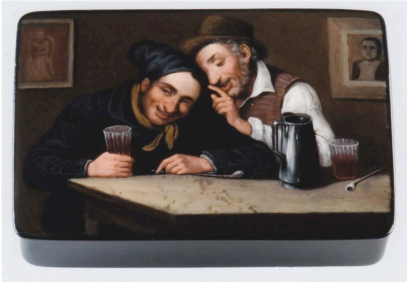
Abb. 8: Schnupftabakdose, bezeichnet »In vino veritas«, Stobwasser-Manufaktur, Braunschweig, 2,1 x 9,2 x 6,8 cm, erstes Drittel des 19. Jahrhunderts, Privatbesitz. Hinter den beiden miteinander flüsternden Trinkern an der Wand zwei Gemälde, eines mit einem Porträt Napoleons.