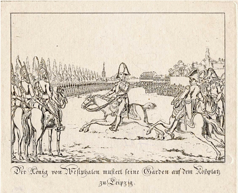
Abb. 3: Christian Gottfried Heinrich Geißler, »Der König von Westphalen mustert seine Garden auf dem Rossplatz«, in: Kriegsszenen bei und in Leipzig im Juni und Juli 1809 , Bl. 9, Leipzig, Jena (Gustav Zehl/J. G. Voigtsche Buchandlung/Kommissionsbuchhandlung), 1810, Radierung, 15,4 x 19 cm, Stadtgeschichtliches Museum Leipzig, Gei IV/22.

hatte, war für die Respektabilität Jérômes und seine Akzeptanz als neuer Monarch nicht vorteilhaft. Es sagt jedoch etwas darüber aus, wie selbstbezogen den Westphalen ihr Staatsoberhaupt erschien. Hinter dem Gerücht, das Jérômes Lebenswandel als töricht und läppisch und die Person des Monarchen für seine Staatsbürger als wenig anziehend darstellte, können anti-westphälisch gesinnte Staatsbürger vermutet werden, die die Ernsthaftigkeit Jérômes als Landesherr in Frage stellten und ihn als Schönling diskreditieren wollten.