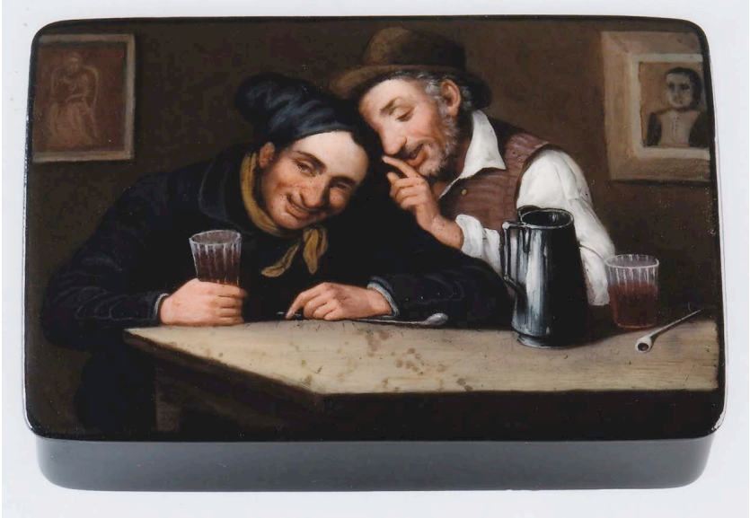
Abb. 8: Schnupftabakdose, bezeichnet »In vino veritas«, Stobwasser-Manufaktur, Braunschweig, 2,1 x 9,2 x 6,8 cm, erstes Drittel des 19. Jahrhunderts, Privatbesitz. Hinter den beiden miteinander flüsternden Trinkern an der Wand zwei Gemälde, eines mit einem Porträt Napoleons.