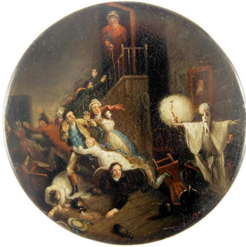
Abb. 5: Schnupftabakdose »Das Geisterspiel«, wohl Raven, Birmigham, um 1830, 2 x 10 cm, Privatsammlung Braunschweig.

tet«, schreibt ein Zeitgenosse, der bei der Gelegenheit das Geheimnis des vermeintlichen Gespenstes lüftet: Im Gewand des Kurfürsten soll ein rache-suchender Verehrer einer Hofdame gesteckt haben, welchem zuvor im Badehaus des Königs die Unannehmlichkeit widerfahren war, in Anwesenheit und zur Belustigung Seiner Majestät entblößt worden zu sein 21 . Die Vorstellung eines abergläubischen und schreckhaften Königs anstelle eines staatsmännischen und unerschrockenen scheint gängig gewesen zu sein: In seiner »Jeromiade« liefert Scheller einige belustigte Verse über Jérôme, der aus Angst vor dem Gespenst des Herzogs von Braunschweig-Oels Braunschweig schlagartig verlässt 22 .