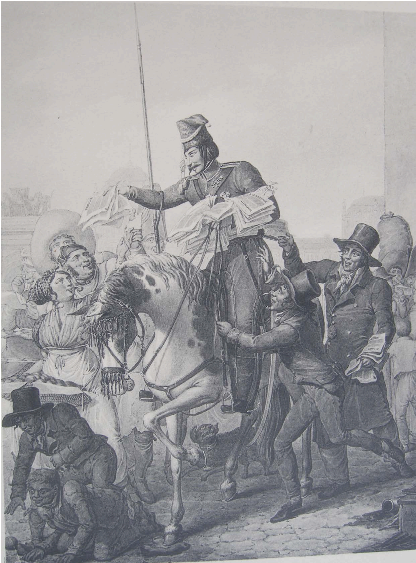
Abb. 6: Ein Kosak verteilt Proklamationen in Paris, 1814, aus: Karl Masner, Erwin Hintze (Hg.), Die historische Ausstellung zur Jahrhundertfeier der Freiheitskriege Breslau 1913 , 2 Bde., Breslau 1916.